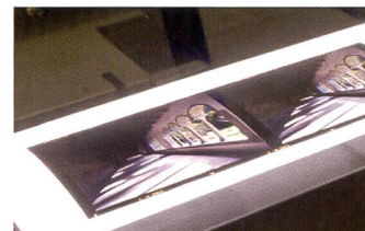
Dank zweiter Linse mit längerer Brennweite gelingen hochauflösende Diascans mit dem Epson V750 perfekt.

ren ermöglicht, natürlich nur unter optimalen Lagerbedingungen im Album. Weniger für Profis, aber für schnelle Ausdrücke von Familienfotos ist die Epson PhotoEnhance-Technologie geeignet, eine Bildkontrolle, die je nach Motiv, vom Porträt über Landschaften oder Stadtkulissen die Faktoren Farbe, Kontrast und Farbverteilung auf die Bildinhalte abgestimmt optimiert.