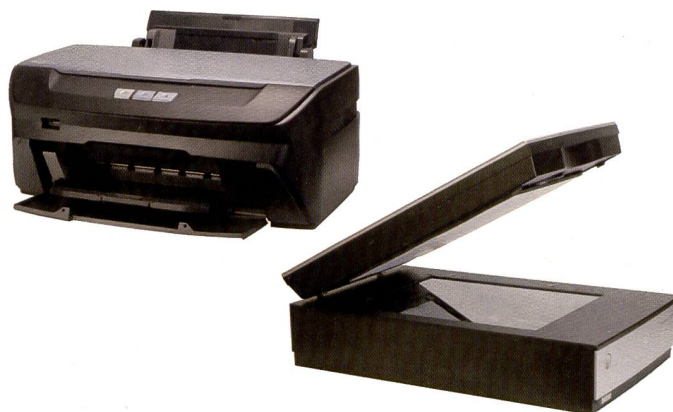
In- und Output: Der Dual Lenses Scanner V750 bietet Profis mehr Auflösung und Schärfe speziell bei Dias, während der schnörkellose Stylus Photo R265 Drucker für günstigen Fotodruck in 6 Farben sorgt.

An der Photokina hat Epson eine Reihe von neuen Produkten nicht nur für Profis gezeigt, welche zu einem guten Preis-Leistungsverhältnis gute Resultate hervorbringen. Wir hatten die Möglichkeit, den neuen Doppellinsen-Scanner V750 und den 6-Farben-Drucker R265 erstmals zu testen.