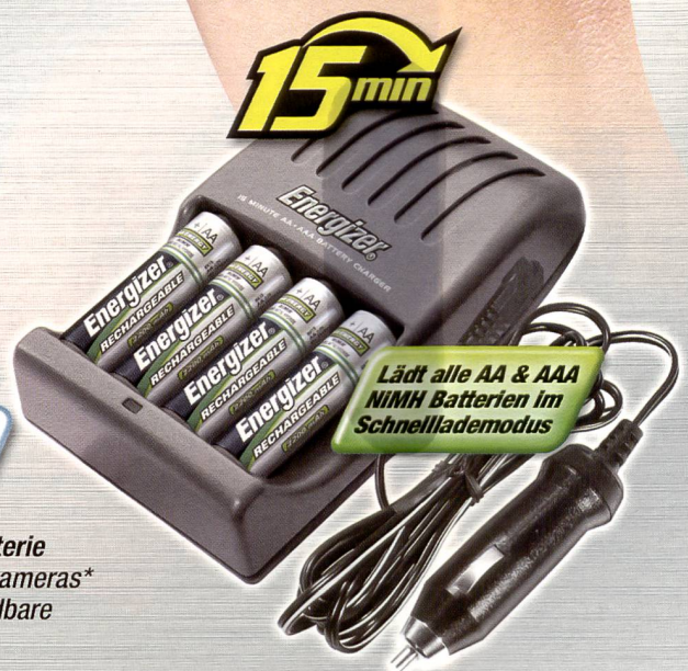
Energizer 15 Minuten Ladegerät