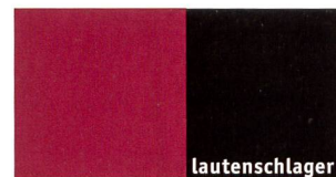
foto lautenschlager ag bionstrasse 5 ch-9015 st.gallen

fon +41 71 278 15 35 fax +41 71 278 15 37 www.foto-lautenschlager.ch info@foto-lautenschlager.ch