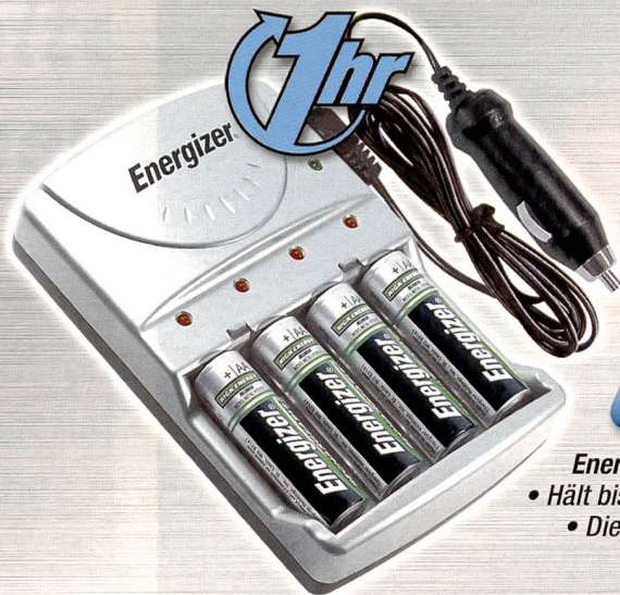
Energizer 1 Stunden Ladegerät