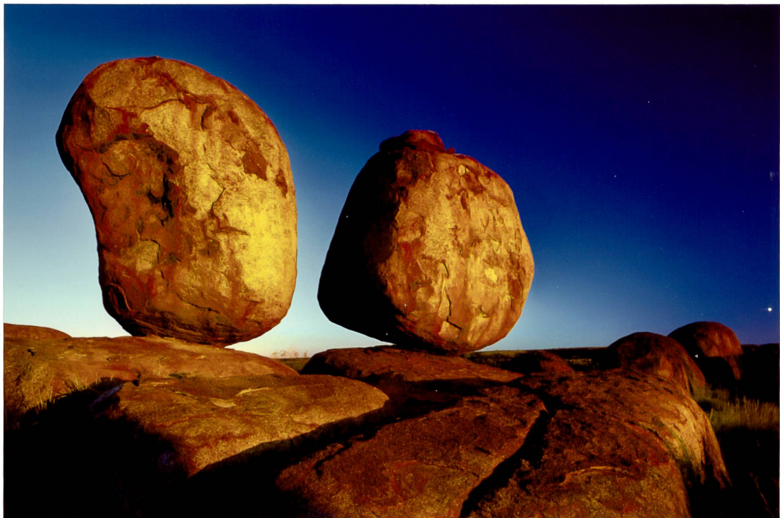
Foto: © Patrick Loertscher • Originalvergrößerung auf ILFORD ILFOCHROME® CLASSIC

fon +41 71 278 15 35 fax +41 71 278 15 37 www.foto-lautenschlager.ch info@foto-lautenschlager.ch