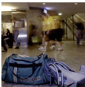
Profis versichern die Ausrüstung mit der All-Risk Police gegen Diebstahl.

Eine gute Versicherung ist für Unternehmer wie Private wichtig. Ob es sich nun um die Altersvorsorge, besondere Risiken oder um das Eigentum geht – stets sollte die Versicherung den Bedürfnissen entsprechen. Für Fotografen ist es wichtig, im Notfall schnell Ersatz für ihr Equipment beschaffen zu können. Die Ausrüstung kann nicht nur auf Rei-