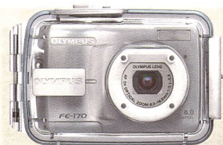
Reiches Angebot an Unterwassergehäusen.