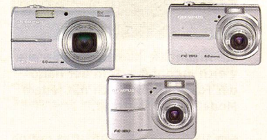
Top Technik, aber einfache Bedienung – die FE-Modelle.

tion. Ausserdem führt Olympus mit einer grossen Auswahl an Unterwassergehäusen den Markt der Wassersport-Fotografen an.