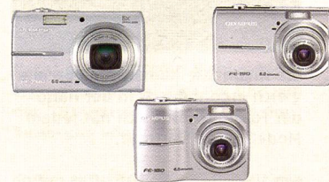
Top Technik, aber einfache Bedienung – die FE-Modelle.

tion. Ausserdem führt Olympus mit einer grossen Auswahl an Unterwassergehäusen den Markt der Wassersport-Fotografen an.