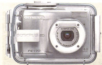
Reiches Angebot an Unterwassergehäusen.