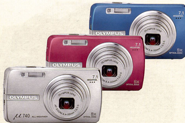
In modischen Farben wird die Mju-Reihe eingeführt, im Bild die \mu 740. Die Schwester \mu 750 verfügt zusätzlich über einen mechanischen Bildstabilisator.