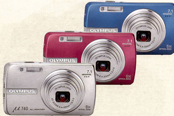
In modischen Farben wird die Mju-Reihe eingeführt, im Bild die \mu 740. Die Schwester \mu 750 verfügt zusätzlich über einen mechanischen Bildstabilisator.