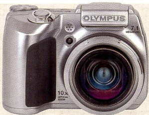
SP-510 UZ: 10-fach Zoom

Die wasserdichte und stossfesten \mu 725 sw (Nachfolgerin der \mu 720 sw) hält einen Wasserdruck entsprechend 5 m Tiefe aus und übersteht einen Sturz aus bis zu 1,5 m Höhe. Weitere Eckdaten sind: 7,1 Millionen Pixel, 6,4 cm grosses LCD, erhältlich ab Oktober 2006 für CHF 628.–.