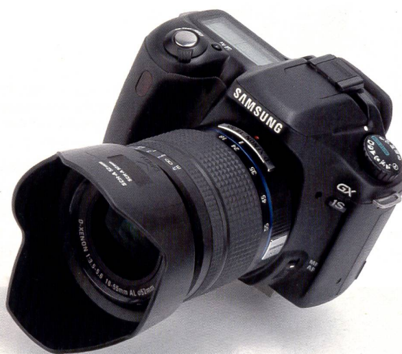
Handlich, elegant und mit dem Pentax Objektiv-Bajonett präsentieren sich die neuen Spiegelreflexkameras GX-1S und GX-1L von Samsung.

Mit der GX-1S legt Samsung die erste digitale Spiegelreflexkamera vor. Die Kamera ist kompakt mit Pentax Objektiven. In der Schweiz wird die GX-S1 aber mit D-Xenon Objektiven von Schneider Kreuznach angeboten. Weitere DSLR-Kameras und Fotoprodukte von Samsung folgen.