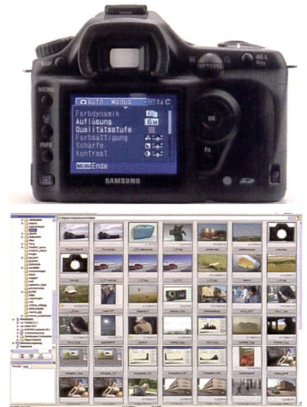
Digitalfilter für die Bilder gibts bereits in der Kamera. Digimaxer-Software für RAW-Daten (unten).

Schluss wird das Bild wahlweise in ein JPEG, 8-Bit Tiff oder 16-Bit Tiff umgewandelt. Der Digimax Master ermöglicht auch das Sortieren und Drucken der Bilder,