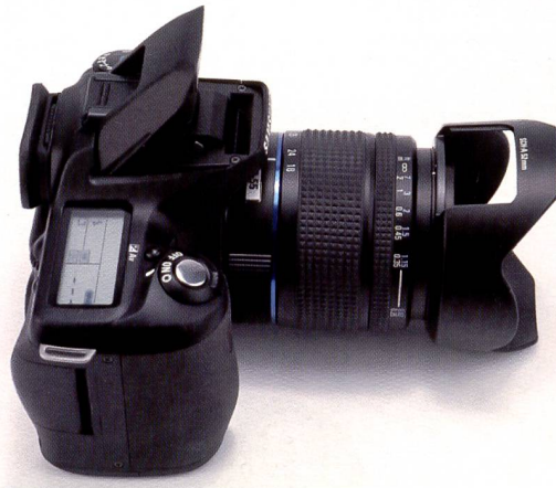
Der Einbaublitz gehört bei einer modernen DSLR «zum guten Ton» (externes Blitzgerät optional). Praktisches Detail: Die abnehmbare Kappe in der Blende zur besseren Bedienung eines Pol-Filters auf dem Objektiv.

leichtern. Ferner ist ein externes Blitzgerät mit Leitzahl 36 und Schwenkreflektor, sechs Leistungsstufen und P-TTL-Technik für kabelloses und Highspeed-