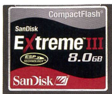
SanDisk Extreme III CompactFlash®