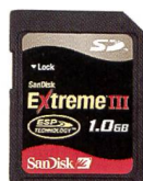
SanDisk Extreme III SD™