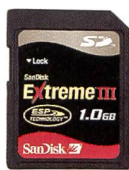
SanDisk Extreme III SD™