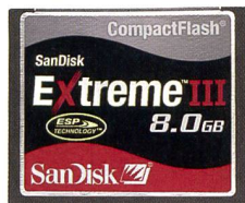
SanDisk Extreme III CompactFlash®