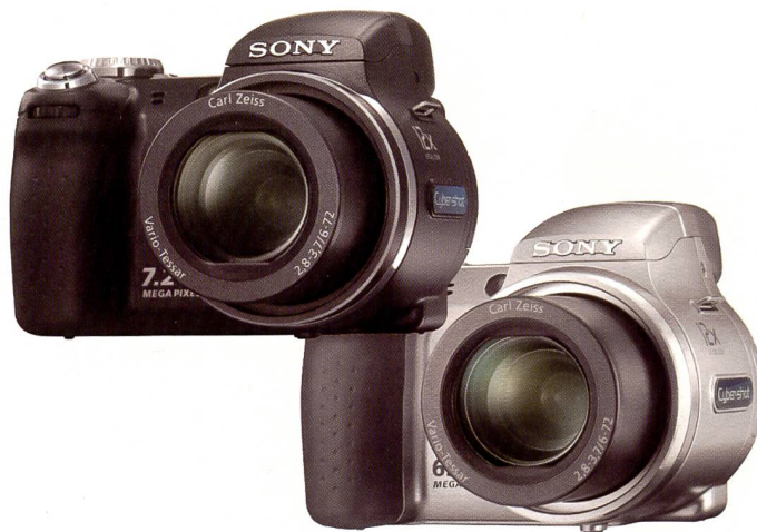
Mit der Cyber-shot H5 (schwarz) und der Cyber-shot H2 (silber) baut Sony rechtzeitig zur Fussball-WM das Angebot der Megazoom-Kameras (12fach) aus, erweiterbar mit Tele- oder Weitwinkelkonvertern und ausgestattet mit Bildstabilisation.

Was ein Multimedia-Anbieter heute zu bieten hat um den Begriff Home Entertainment aus einer Hand und in durchgängigem modernem Design zu zeigen, hat Sony an der Frühlingsausstellung «Sonyville» demonstriert: Von der neuen Kamerareihe über Camcorder bis Beamer