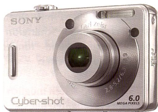
Die Cyber-shot W30 und W50 (im Bild) mit 6 Megapixel fallen durch die schlanke Bauweise auf.

Mit der neuen Cyber-shot W-Serie setzt Sony noch stärker auf edles Design kombiniert mit hochwertiger Technik. Die Modellen W30 sowie W50 verfügen beide über 6-Megapixel, haben aber gleichzeitig eine Schlankheitskur erhalten und sind nun deutlich dünner als die Vorgängermodelle. Animierte Menüs sowie Erklärungen für die Icons