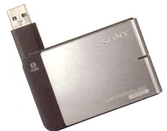
8 Giga Speicher in der Hosentasche mit dem Microvault Pro.

Ein Carl Zeiss Vario-Tessar Objektiv mit einem 12-fachen optischen Zoom und einer Brennweite von 36 bis 432 mm holt bei den beiden neuen Sony Cyber-shot H2 und H5 weit entfernte Motive näher. Wenn der Brennweitenbereich des Carl Zeiss-Objektivs der H2 und H5 nicht ausreicht, kann diesen durch optionale Sony Ob-