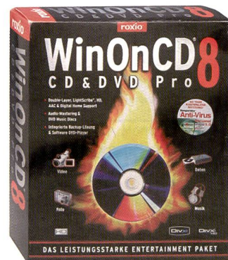
In der Box finden sich: WinOnCD 8, Features-CD, als dritte CD «Kaspersky»-Anti-Virus sowie Handbuch.

gehörige Datenverwaltung ist. Audio-CDs sind einfach zu erstellen mit verschiedenen Ein- und Ausgabeformaten, der Möglichkeit, MP3-Dateien übers Internet mit Informationen zu ergänzen (ideal zum Kopieren von Musik-CDs, da dann anstelle «Unbekannter Interpret» über eine Datenbank plötzlich alle Informationen dem Stück beigelegt werden) sowie optionalen Rauschfil-