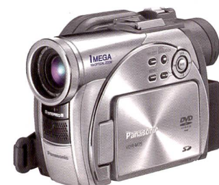
Panasonic VDR-M75: Mini-DVD.