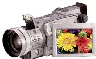
Canon MVX3i: Highend-MiniDV-Cam.