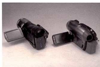
Sony gibt mit dem High Definition 1080i den Standard für ambitionierte Amateure vor. Daneben ein Mini-DVD-Camcorder, der DCR-DVD403 mit drei Megapixeln.

Beim DV-Camcorder MVX3i handelt es sich um ein «traditionelles» 1-Chip-Modell. Der 2,2-Megapixel CCD-Chip mit RGB-Primärfilter und das 10fache op-