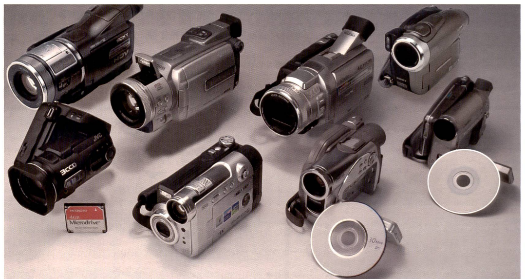
Die grosse Auswahl an modernen Camcordern: Es gibt alles – vom hochauflösenden HD-Gerät von Sony (hinten links) bis zum kompakten Harddiskgerät von JVC (vorne links) oder dem exotischen aber handlichen Samsung Kombigerät mit 5-Megapixel-Kamera und Camcorder im gleichen Gehäuse (vorne Mitte).

Der Verkauf von Videokameras hat sich nach dem Boom der 80er-Jahre auf einem stabilen Niveau eingependelt. Neue Technologien, unterstützt durch die oft wenig berauschenden Aufnahmeergebnisse mit Digitalkameras im Videobereich, können dem Verkauf von Videokameras neuen Aufschwung verleihen.