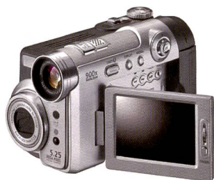
Samsung VPD6550i: 2-in-1 Digicam.