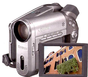
Canon DC20: direkt auf Mini-DVD.

Für eine einfachere Handhabung sind sowohl der Aufnahme- als auch der zweite Zoom-Button direkt am Display angebracht. So kann der Filmer die Kamera ruhiger und stabiler halten. Kleine Wacklern korrigiert die Super SteadyShot-Funktion. Mit Super NightShot sind Filme auch ohne Tageslicht möglich. Das Modell DCR-DVD403 verfügt über eine Auflösung von 3 Megapixel und ermöglicht auch Standbilder. Bei der DVD-Reihe setzt Sony auf die acht Zentimeter grossen DVD-R/-RW/+RW als Speichermedium.