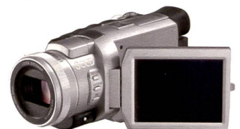
Panasonic NV-GS400: MiniDV-Profi.