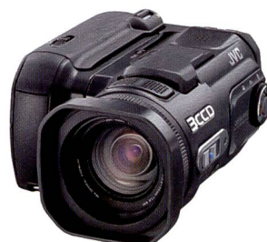
JVC Everio GZ-MC500: Harddisk