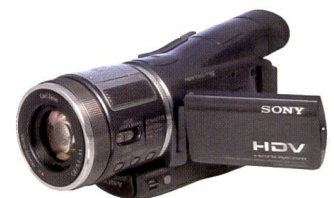
Sony HDR-HC1: High Definition.

von Sony, der speziell für begeisterte Hobbyfilmer mit hohen Ansprüchen konzipiert wurde. Er ist mit einem 3 Megapixel CMOS-Sensor ausgestattet und ist mit seinen Abmessungen von 71 x 94 x 188 Millimeter sehr kompakt. Das Gewicht beträgt 670 Gramm (ohne Akku & Kassette).