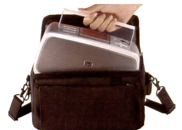
Der Photosmart 475: Portabel mit Tasche und Akku und Platz für 1000 Bilder als externer Speicher.

gen. Mit der modularen Drucktechnologie hat der Anwender die Möglichkeit, einzelne Farben einfach auszuwechseln. Die HP Technologie basiert auf den sechs Vivera Tintenpatronen, einem permanent, für die Lebensdauer des Druckers genutzten Druckkopf mit Tintenreservoir, einer Pumpe, einer Lüftung und einem Tintensensor.