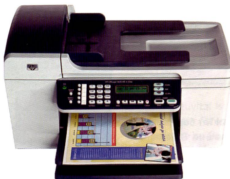
In den Multifunktionsgeräten «All-in-One» wie dem Officejet 5610 sieht HP eine grosse Zukunft: Einfaches Handling und kompakt im Service.

dank der «Single Ink Generation II» mit einer speziellen, besonders effizienten Tintenzirkulation zwischen Patrone und Druckkopf. Der HP Photosmart 8250 druckt mit HP Vivera Tinten in Schwarz, Cyan, Magenta, Gelb, Cyan hell und Magenta hell. Der Drucker nutzt sie je nach Bedarf variabel – bei Texten ausschliesslich schwarz, farbige Dokumente werden mit vier Farben und Fotos mit sechs Farben gedruckt. Die HP Vivera Drucktinten zeichnen sich durch besonders hohe Qualität und Haltbarkeit aus, die auf ei-