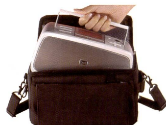
Der Photosmart 475: Portabel mit Tasche und Akku und Platz für 1000 Bilder als externer Speicher.

gen. Mit der modularen Drucktechnologie hat der Anwender die Möglichkeit, einzelne Farben einfach auszuwechseln. Die HP Technologie basiert auf den sechs Vivera Tintenpatronen, einem permanent, für die Lebensdauer des Druckers genutzten Druckkopf mit Tintenreservoir, einer Pumpe, einer Lüftung und einem Tintensensor.