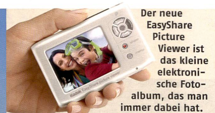
Der neue EasyShare Picture Viewer ist das kleine elektronische Fotoalbum, das man immer dabei hat.

Welche Bedeutung kommt Ihrer Meinung dem Internet als Bildtransportmittel zu?