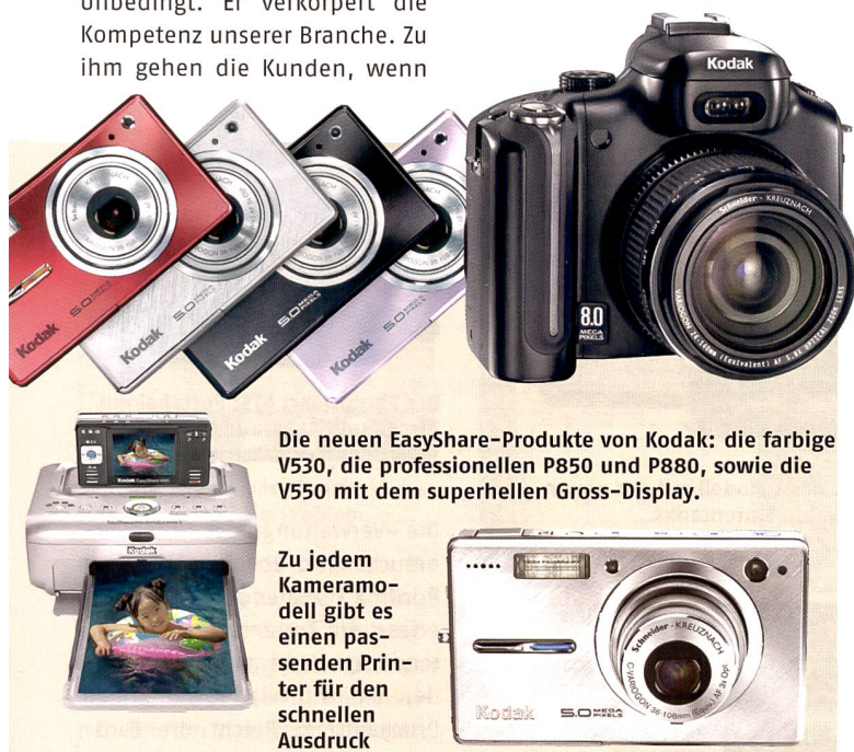
Die neuen EasyShare-Produkte von Kodak: die farbige V530, die professionellen P850 und P880, sowie die V550 mit dem superhellen Gross-Display.

Zu jedem Kameramodell gibt es einen passenden Printer für den schnellen Ausdruck