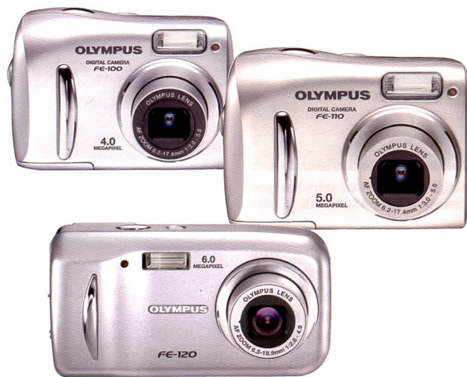
Einsteigermodelle hoher Qualität: Olympus FE-100, FE-110 und FE-120

Olympus hat mit dem Ziel, die digitale Fotografie für jedermann erschwinglich und einfach beherrschbar zu machen mit dem Kernsatz FE – für friendly and easy – das Sortiment mit einer weiteren Kamera der mju-Serie und einem günstigen Thermosublimationsdrucker erweitert.