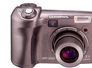
Olympus SP-310: 7,1 Megapixel

Die Olympus SP-500UZ ist mit einem 10fach-Zoom-objektiv (entspricht 38 – 380 mm bei einer 35-mm-Kamera) ausgestattet, das mit 1:2,8 – 3,7 über den gesamten Brennweitenbereich besonders lichtstark ist. Die Kamera verfügt über