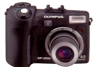
Olympus SP-350: 8 Megapixel

Mit Einbruch der Dämmerung zeigt die 6-Millionen-Pixel-Kamera µ Digital 600, was sie wirklich kann: Das 6,4 cm grosse LCD stellt das Motiv auch bei schlechten