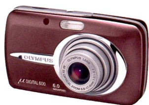
Olympus μ DIGITAL 600

30 Bildern pro Sekunde aufgezeichnet werden. Die Olympus SP-500UZ ist mit ihrem geringem Umfang und Gewicht sowie der Top-Ausstattung ideal für Sportaufnahmen, Wanderungen in der freien Natur sowie auf Reisen. Sie ist zum Preis von Fr. 628.- erhältlich.