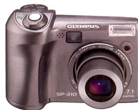
Olympus SP-310: 7,1 Megapixel

Die Olympus SP-500UZ ist mit einem 10fach-Zoomobjektiv (entspricht 38 – 380 mm bei einer 35-mm-Kamera) ausgestattet, das mit 1:2,8 – 3,7 über den gesamten Brennweitenbereich besonders lichtstark ist. Die Kamera verfügt über