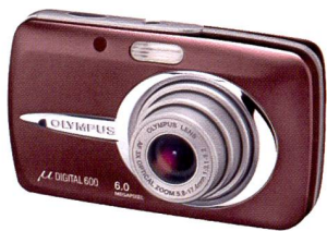
Olympus µ DIGITAL 600

Die Initialen FE stehen für friendly and easy – freundlich, sprich: benutzerfreundlich und einfach. Bei der Entwicklung wurden deshalb in besonderer Masse die Bedürfnisse von Einsteigerinnen und Einsteigern berücksichtigt. Die FE-110 und FE-100 von Olympus liefern 5 Millionen bzw. 4 Millionen Pixel und 2,8fach-Zoomobjektiv. Beide Modelle lassen sich nicht zuletzt deshalb einfach bedienen, weil die Bedienelemente gut positioniert wurden und jede Taste mit nur einer Funktion belegt ist.