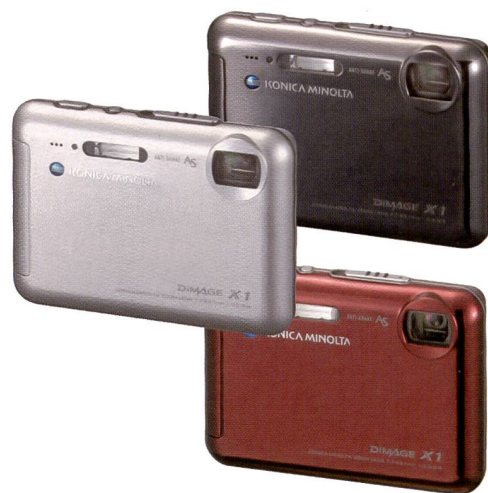
Dimage X1 gibt es in drei Farben – Silber, Schwarz und Weinrot.

Vielseitige Aufnahmefunktionen und Einstellmöglichkeiten machen die Dynax 5D zu einer attraktiven Einsteigerkamera. Das Autofokussystem mit neun