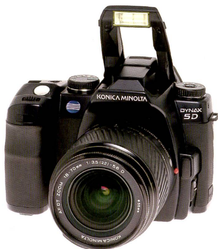
Von der neuen Dynax 5D verspricht sich Konica Minolta einen Schub bei der Ablösung der Analogkameras, aber auch Anreize für Neueinsteiger.

Bei Konica Minolta hat man sich ein hohes Ziel gesteckt. Mit der neuen digitalen Spiegelreflexkamera Dynax 5D will man dorthin, wo man in den achtziger Jahren war: an die Spitze. Der Weg dorthin ist ein steiniger – gepflastert mit Produkten der Konkurrenz.