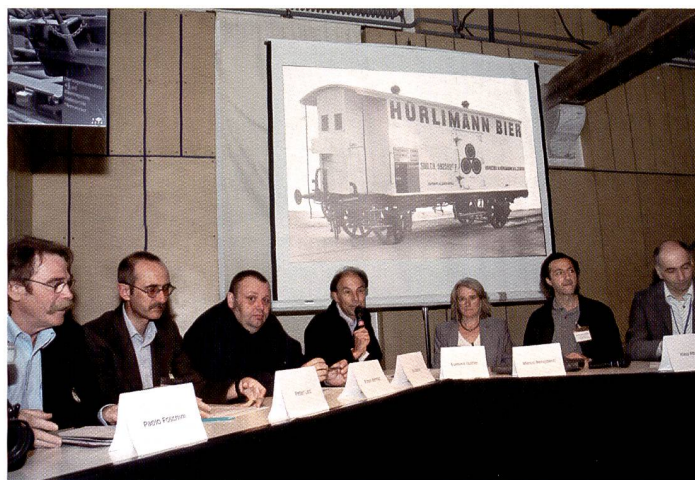
Vor der Eröffnung der «click!05» präsentierten die Initianten von photoswiss.ch ihr Konzept den Medien.

Keine Fusion, sondern ein Zusammenschluss von unabhängigen Bildagenturen - das ist Photoswiss.ch. Gemeinsam bietet man eine Suchplattform an und will sich gegenseitig helfen, die Kundschaft zu bedienen. Wer das Passwort einer Agentur hat, kann auch auf die Anderen zugreifen.