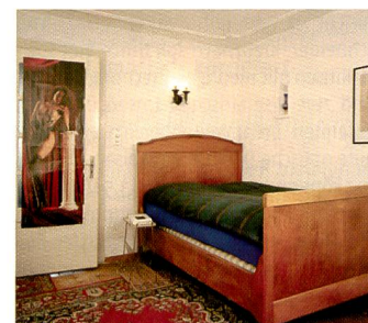
Sechs Arbeiten nehmen zusätzlich an der Ausstellung teil, wie die nostalgisch-provokante Serie «sans titre» von Sandra Guignard.

diskussion schnell auf diese Konzeptarbeit, mit der Begründung, dass «ein aktuelles Thema in einer modernen Sprache mit konventionellen Mitteln – nicht digital – umgesetzt wurde». Nico Krebs, geboren 1979 in Winterthur, und Taiyo Onorato, geboren 1979 in Zürich, absolvieren beide die Fotografie Fachklasse an der Hochschule für Gestaltung und Kunst, Zürich HGKZ.