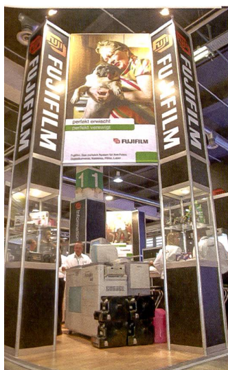
Grösser, schöner, aufwändiger: Noch nie hatten die Aussteller so viel in den Standbau investiert. Die leichte Öffnung der Messe zu einem breiteren Publikum dürfte die Ursache sein.

2003 wurden einige Stimmen laut, die gerne zumindest an einem Tag (Mittwoch oder Donnerstag) Öffnungszeiten bis 22 Uhr wünschten, um auch den Profifotografen und interessierten Amateuren eine Chance auf einen Messebesuch zu geben, die tagsüber bis über den Kopf in Arbeit stecken. Zahlreiche Messebesucher wie Aussteller zeigten sich empört ob der immer noch horrenden Parkgebühren in den benachbarten Parkhäusern, eine pauschal bezahlte Parkkarte für die Mesседauer könnte da eine Lösung sein.