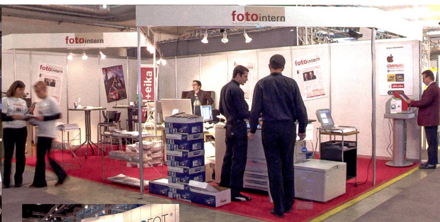
Einer der Höhepunkte der Professional Imaging fand am Stand von Fotointern statt: «Halfdaily», die Messezeitung, wurde täglich zweimal am Stand produziert, das heisst geschrieben, gelayoutet und gedruckt und jeweils pünktlich um 9 Uhr zur Eröffnung der Messe und um 14 Uhr den Besuchern verteilt.