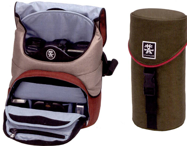
Originell war nicht nur der Messeauftritt von Crumpler mit einem Malkindergarten in vier Wänden – frisch und originell ist auch das Taschendesign.

Der australische Taschenhersteller Crumpler hat neben Taschen für Laptops, digitale SLR- und Kompaktkameras und weiteren Behältnissen auch Rucksäcke und Taschen für CD's, Diskman und ähnliches Lifestyle-Zubehör, alles in buntem und trendigen Design.