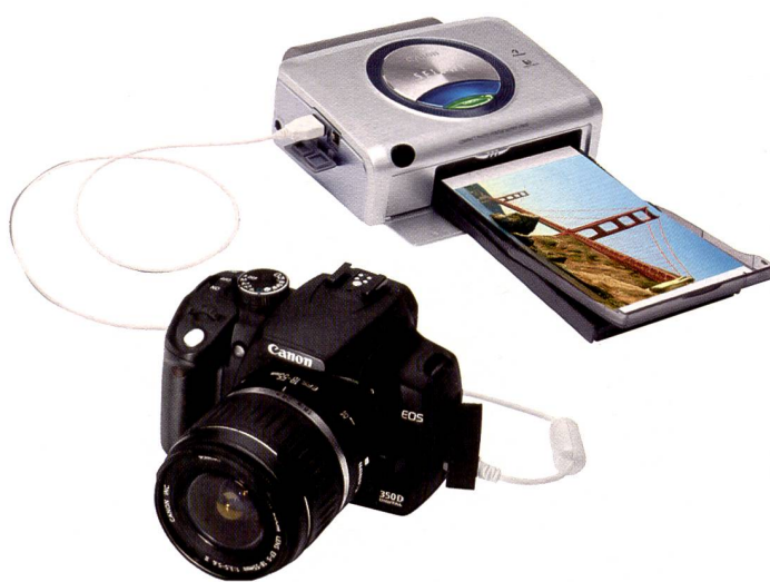
Direktdruck dank PictBridge: Der Ausdruck ohne Umweg über den Computer ist auch für das Spiegelreflexmodell Canon EOS 350D kein Problem.

Mit der EOS 350D stellt Canon die Nachfolgerin der EOS 300D vor. Die Kamera wartet mit einem neu entwickelten 8 Megapixel CMOS-Sensor auf. Ausserdem wurde der 350D der Digic II Bildprozessor verpasst, der auch in den Profimodellen für schnelle Bilder sorgt.