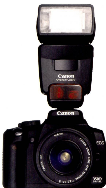
Mit externen Speedlite Blitzgeräten hat die 350D mehr Power.