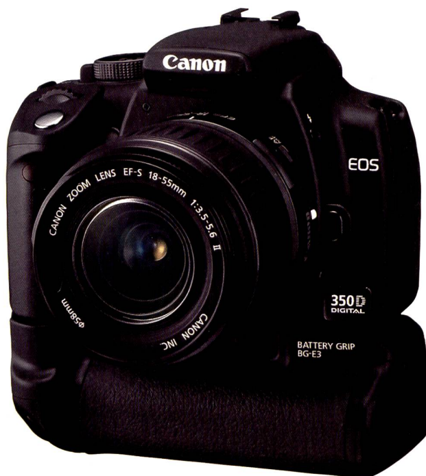
Fotografieren wie die Profis ist mit dem optional erhältlichen Batteriegriff BG-E3 möglich.