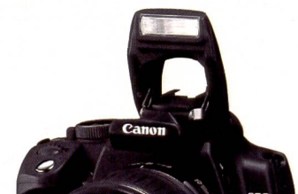
Die Bedienelemente sind am gewohnten Platz. Der Einbaublitz ist besonders weit vom Objektiv entfernt.