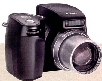
Die DX 7590 Easy Share: 10fach-Zoom und 5 Megapixel Auflösung in einem kompakten Gehäuse – eine qualitativ hochstehende und doch einfach zu benutzende Digitalkamera.

Lösungen für «on demand Colour Printing» sind Teil der Commercial Printing Abteilung, die kürzlich