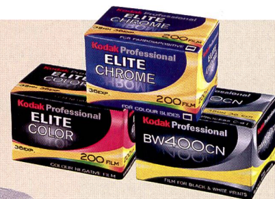
Kodak Filme gehören nach wie vor zum wichtigen Standbein des Sortiments.