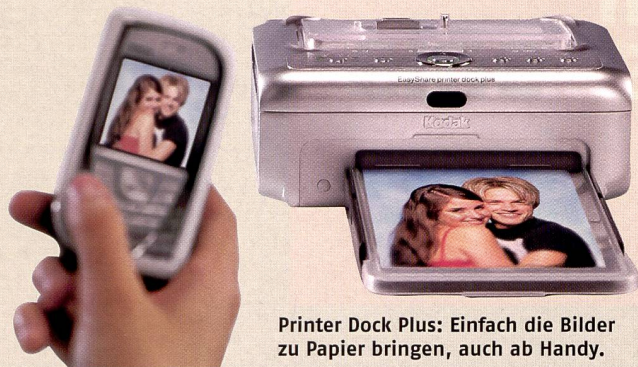
Printer Dock Plus: Einfach die Bilder zu Papier bringen, auch ab Handy.

vollständig von Kodak übernommen wurde. Mit Versamark für variables Data printing und dem Inkjet-Printer-Programm Encad stellt diese Abteilung ein enormes Wachstumspotential für Kodak dar. Die Nexpress Ausrüstungen ermöglichen beispielsweise die Realisierung von digitalen Fotoalben, nach denen in den Fotokanälen grosse Nachfrage herrscht.