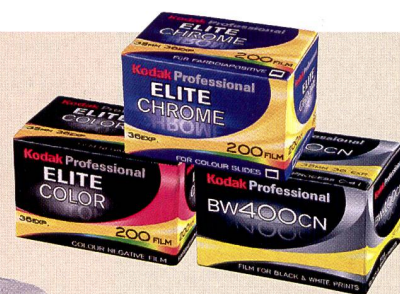
Kodak Filme gehören nach wie vor zum wichtigen Standbein des Sortiments.