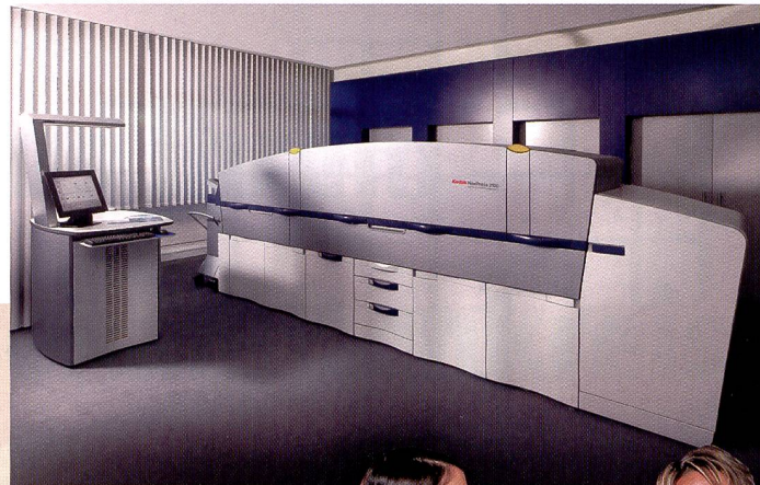
Mit Kodak Nexpress lassen sich digitale Druckaufträge realisieren wie die boomenden gebundenen Fotoalben.