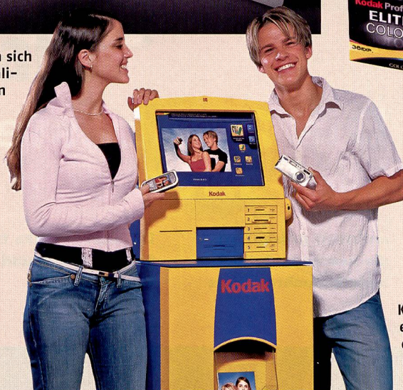
Kodak Fotokioske haben ein grosses Potential für den Ausdruck von Bildern ab digitalen Medien wie Fotohandys.

Prozent Wachstum des gesamten Einkommens sehr stark entwickelt.