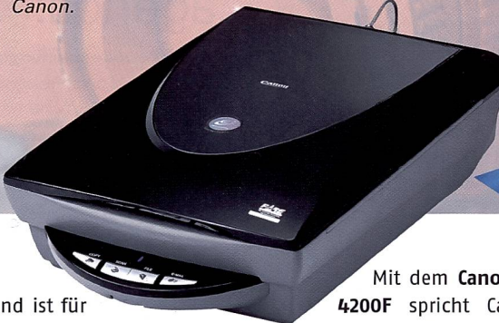
Der erste Flachbettscanner mit Platz für 30 Negative, der CanoScan 9950F von Canon.