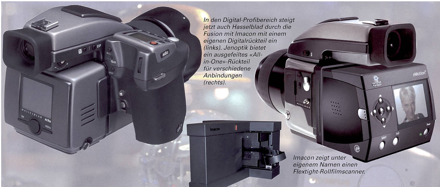
In den Digital-Profibereich steigt jetzt auch Hasselblad durch die Fusion mit Imacon mit einem eigenen Digitalrückteil ein (links). Jenoptik bietet ein ausgefeiltes «All-in-One»-Rückteil für verschiedene Anbindungen (rechts).

Mpix für Mittelformat- und Fachkameras vor. Auszeichnen soll sich diese vor allem durch den geringen Energieverbrauch und seine leichte, aber stabile Bauweise. Der geringe Stromverbrauch wirkt sich auch positiv auf die Bildqualität aus; da die Erwärmung der Kamera auf ein Minimum reduziert ist, wodurch kaum Probleme mit dem Bildrauschen auftreten. Das Eye-like eMotion22 kann bis zu 50 Aufnahmen pro Minute, bzw. alle 1, 2 Sekunden eine Aufnahme. Es ist mit einem Festspeicher für rund 140 Aufnahmen ausgerüstet, kann aber zusätzliche Bilder