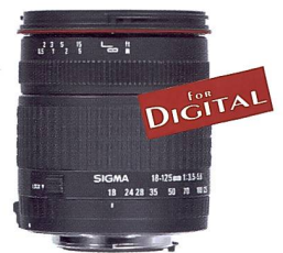
SIGMA-Zoom 18-125 mm F3,5-5,6 DC

Dieses neue Superzoom wurde exklusiv für die Anforderungen digitaler SLR-Kameras entwickelt und deckt vom Weitwinkel bis zum Teleobjektiv ein breites Spektrum an Einsatzgebieten ab. Der Abbildungsmaßstab entspricht etwa dem beliebten Sigma-Zoom 28-200 mm für analoge Kameras. Ein SLD Glaselement und zwei asphärische Linsenelemente sorgen für eine hohe Abbildungsqualität über den gesamten Zoombereich und ermöglichen zudem ein kompaktes und leichtes Design. Das Objektiv ist mit einer präzisen Innenfokussierung ausgestattet, wodurch sich die Frontlinse beim Scharfstellen nicht mitdreht. Erhältlich in den Anschlüssen Nikon, Canon, Pentax und Sigma.