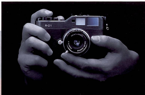
Die erste digitale Messsucherkamera im Retro-design kommt von Epson.

Auch 2004 hat die photokina in Köln eine überwältigende Vielfalt an Neuheiten präsentiert, nach Aussage eines Herstellers in der einzigen Branche mit Wachstum. Fotointern hat in einem ersten Rundgang eine Handvoll Neuheiten zusammengetragen.