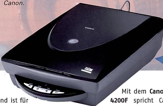
Der erste Flachbettscanner mit Platz für 30 Negative, der CanoScan 9950F von Canon.