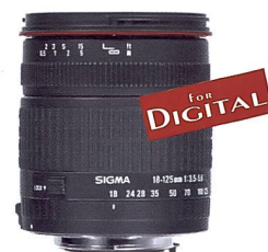
SIGMA-Zoom 18-125 mm F3,5-5,6 DC

Dieses neue Superzoom wurde exklusiv für die Anforderungen digitaler SLR-Kameras entwickelt und deckt vom Weitwinkel bis zum Teleobjektiv ein breites Spektrum an Einsatzgebieten ab. Der Abbildungsmaßstab entspricht etwa dem beliebten Sigma-Zoom 28-200 mm für analoge Kameras. Ein SLD Glaselement und zwei asphärische Linsenelemente sorgen für eine hohe Abbildungsqualität über den gesamten Zoombereich und ermöglichen zudem ein kompaktes und leichtes Design. Das Objektiv ist mit einer präzisen Innenfokussierung ausgestattet, wodurch sich die Frontlinse beim Scharfstellen nicht mitdreht. Erhältlich in den Anschlüssen Nikon, Canon, Pentax und Sigma.