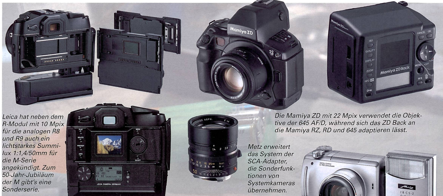
Leica hat neben dem R-Modul mit 10 Mpix für die analogen R8 und R9 auch ein lichtstarkes Summilux 1:1,4/50mm für die M-Serie angekündigt. Zum 50-Jahr-Jubiläum der M gibt's eine Sonderserie.

Die Nikon-Neuheiten, namentlich die analoge Spiegelreflexka-