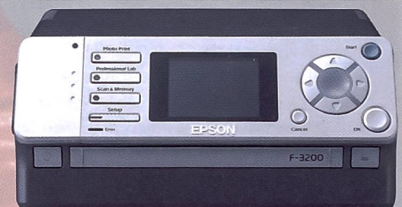
Epson FilmScanner F-3200, Multiformat und für Stapelscans.

Die erste digitale Messsucherkamera Epson R-D1 , entwickelt in Zusammenarbeit mit Cosina, ist mit einem 6-Mpix-Sensor ausgestattet und kann mit nahezu allen Objektiven mit Leica M-