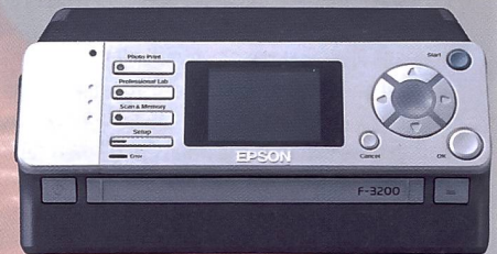
Epson Filmscanner F-3200, Multiformat und für Stapelscans.

Die erste digitale Messsucherkamera Epson R-D1 , entwickelt in Zusammenarbeit mit Cosina, ist mit einem 6-Mpix-Sensor ausgestattet und kann mit nahezu allen Objektiven mit Leica M-