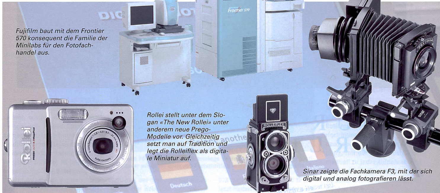
Fujifilm baut mit dem Frontier 570 konsequent die Familie der Minilabs für den Fotofachhandel aus.

Sinar hat eine neue universelle Fachkamera für digitale Fotografie, die F3 , vorgestellt. Sie lässt sich mit entsprechendem Adapter auch mit einem Filmmagazin bestücken. Die F3 verfügt – wie auch die digitale Studiokamera P3 – über integrierte Kontakte. Darüber können ohne zusätzliche Kabel die elektronischen Zwischenlinsenverschlüsse der CMV-Objektivreihe angesteuert werden.