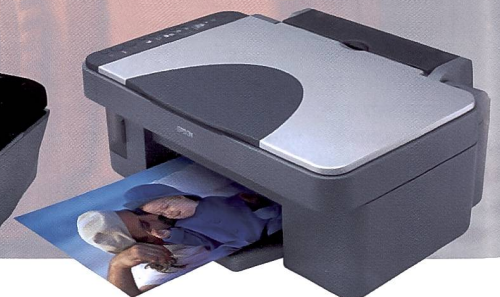
Alleskönner Epson Stylus Foto RX420: Scanner, Drucker und Kopierer.

und R-Bajonett bestückt werden. Mit der Kamera wird die Entfernung manuell eingestellt, während Verschlusszeiten von 1/2'000 bis 1 Sekunde gewählt werden können. Die R-D1 besitzt verschiedene Weissabgleiche und ist mit einem Blitzschuh versehen. Praxisgerecht ist auch der dreh- und schwenkbare Monitor.