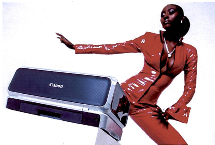
Ein schlichtes einheitliches Design zeichnet die ganze Reihe der neuen Pixma Tintenstrahldrucker von Canon aus.

Mit der Pixma-Reihe tanzt Canon auf zwei Hochzeiten. Einerseits beinhaltet die neue Serie Inkjet Drucker für den Office- und Heimbereich, andererseits spricht man mit den Fotodruckern ambitionierte Amateure und Fotoprofis an, die ihre Bilder zu Hause oder im Studio selbst ausdrucken wollen.