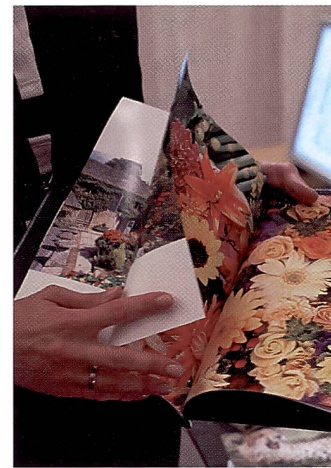
Fotoalben ab digitalen Daten liegen im Trend.

Die beiden Druckermodelle Pixma iP3000 und Pixma iP4000 werden mit folgender Software geliefert: