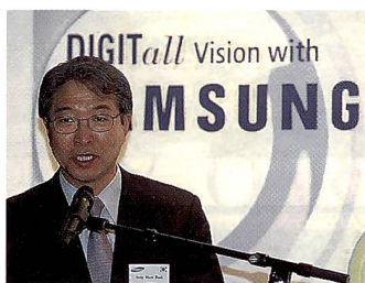
Jonghum Park, CEO Samsung.

Es können auch bewegte Szenen im Videomodus mit 30 Bildern pro Sekunde und VG-Auflösung als MPEG-4 mit Ton abgespeichert werden. Mit den als Zubehör erhältlichen Weitwinkel- und Televorsätzen können kreative Möglichkeiten der neuen Samsung V50 (und der V40) ebenso erweitert werden wie durch die Nahaufnahmemöglichkeit ab vier Zentimeter.