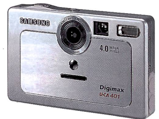
Ob die Samsung Digimax U-CA 401 in der Schweiz lieferbar sein wird, stand zum Redaktionsschluss noch nicht fest.