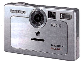
Ob die Samsung Digimax U-CA 401 in der Schweiz lieferbar sein wird, stand zum Redaktionsschluss noch nicht fest.