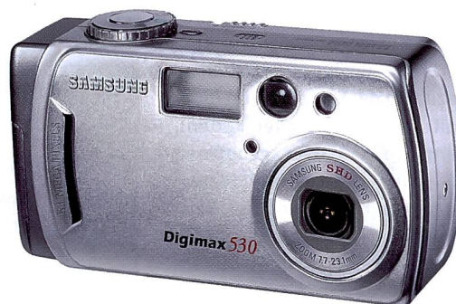
Digimax 530: preisgünstigste 5 Mpix-Kamera von Samsung.

ra entweder schützend gegen innen geklappt oder gegen aussen als Einstellbildschirm benutzt werden. In gedrehter Position kann entweder «ums Eck» fotografiert oder Selbstporträts gemacht werden. Er ist aber ebenso nützlich, um – nach unten gerichtet – über eine Menschenmenge hinweg zu