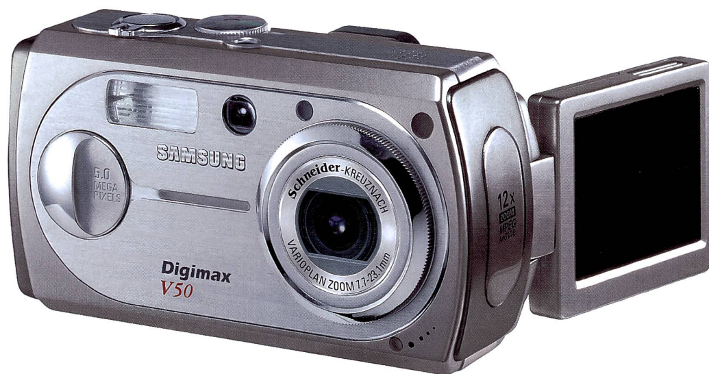
Samsung Digimax V50, das Topmodell mit 5 Megapixel sowie dreh- und schwenkbarem Monitor.

Entwicklung sechsmal mehr Leute als im Jahr 2001. Es ist ein motiviertes Team, dass sich allen Herausforderungen des Marktes stellen wird».