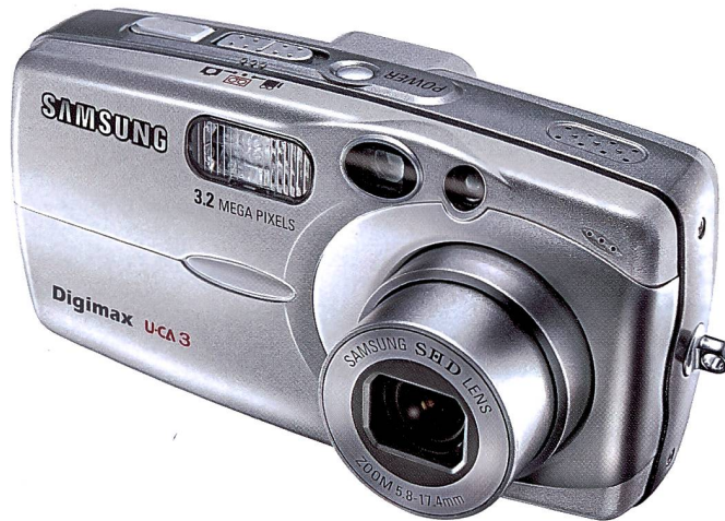
Die Digimax U-CA 3 ist mit ihrem unverwechselbaren Design erfolgreich.

Das bisherige Digimax Battery I-Pack, das weltweit erste CR-V3 Lithium-Ionen Akkupaket, ist mit 1300 mAh weiter verbessert wor-