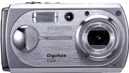
Die Digimax V 40 bietet viel Technik für wenig Geld.