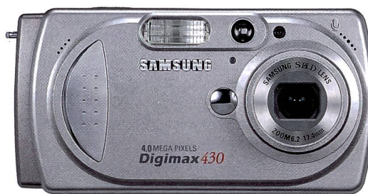
Die Digimax 430 ist in der Schweiz bereits auf dem Markt.

digital), das nicht von Schneider stammt. Auch besitzt die Digimax 530 die Möglichkeit manueller Einstellungen von A, S und M. Nahaufnahmen sind bis zu einer Entfernung von sechs Zentimetern sowie Videoaufnahmen mit Ton möglich. Die Aufzeichnungen erfolgen entweder im internen Spei-