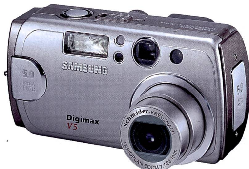
Die Digimax V5 verzichtet auf den Schwenkmonitor.

Im aktuellen Leadermodell von Samsung, der Digimax V50 mit fünf Megapixel, sind eine Reihe interessanter technologischer Features zu finden, die dem Anwender verschiedene praktische Vorteile bieten. Neu ist vor allem der schwenkbare und um 270 Grad drehbare Bildschirm, der Aufnahmen aus verschiedensten Perspektiven zulässt. Er kann hinten an der Kame-