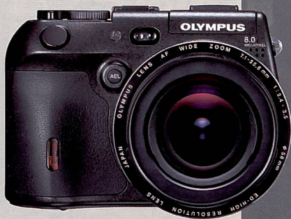
Olympus zeigte die C8080 Wide Zoom mit 8 MP und TruePic Turbo Prozessor.

grafen. Das lichtstarke Hochleistungsobjektiv mit 10-fach Zoom und einer Brennweite von 5,7-57 mm (KB 35-350 mm) wird ergänzt durch eine Reihe von ausgefeilten Einstellmöglichkeiten. Darüber hinaus bietet sie die Möglichkeit zur Videoaufzeichnung. Eine Schärfereinstellung ist im Weitwinkel-Bereich zwischen 50 cm und unendlich, im Telebereich von 120 cm bis unendlich möglich. Bei Makroaufnahmen ist der Mindestabstand zum Mo-