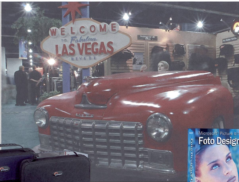
Auch elektronische Geräte und CD swollen fachgerecht transportiert sein: Lowepro Aspen Serie.