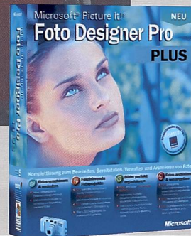
Neu von Microsoft: Programme speziell für die Bildbearbeitung. Aber auch Windows XP erlaubt bereits den praktischen Umgang mit Bilddaten.

ganz einfach in Schlupftaschen verstaut. Der Handgriff wird teleskopartig ausgefahren und besteht im Gegensatz zu früheren Modellen platzsparend nur aus einem Rohr. Der Innenraum kann den eigenen Bedürfnissen entsprechend unterteilt werden und beinhaltet zudem mehrere Fächer für Zubehör. Der Rucksack hat ausserdem Laschen (SlipLock) zur Befestigung von zusätzlichen Accessoires. Ein eingebauter Regenschutz sorgt für zusätzliche Sicherheit bei schlechtem Wetter. Die Taschen der Aspen -Reihe sind speziell für den Transport von portablen CD-Abspielgeräten, CDs und DVDs konzipiert. Das Gerät wird dabei so verpackt, dass es jederzeit zugänglich ist, ohne dass man es aus der Hülle nehmen muss. Die CD-Taschen