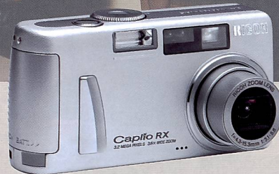
Die Ricoh Caplio RX zeichnet sich vor allem durch den erweiterten Zoombereich aus, der mit 28mm ein echtes Weitwinkelfeeling vermittelt.

D-580 Zoom in der Produktpalette. Ein grosser 1,8" Display für Livebild und Bildvorschau, eingebautes Mikrofon für Audioaufnahmen und die Möglichkeit ohne Computer drucken zu können sind einige Merkmale dieser mit einem 4-Megapixel-Sensor und Vierfachzoom ausgestatteten Kamera.