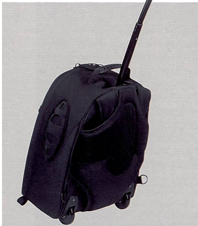
Der Lowepro Rolling Mini Trekker AW schont den Rücken und bietet Platz für die professionelle Ausrüstung.

Kiosk heisst die Stalone-Lösung von Mitsubishi, die von der Dateneingabe bis zum Druck alles