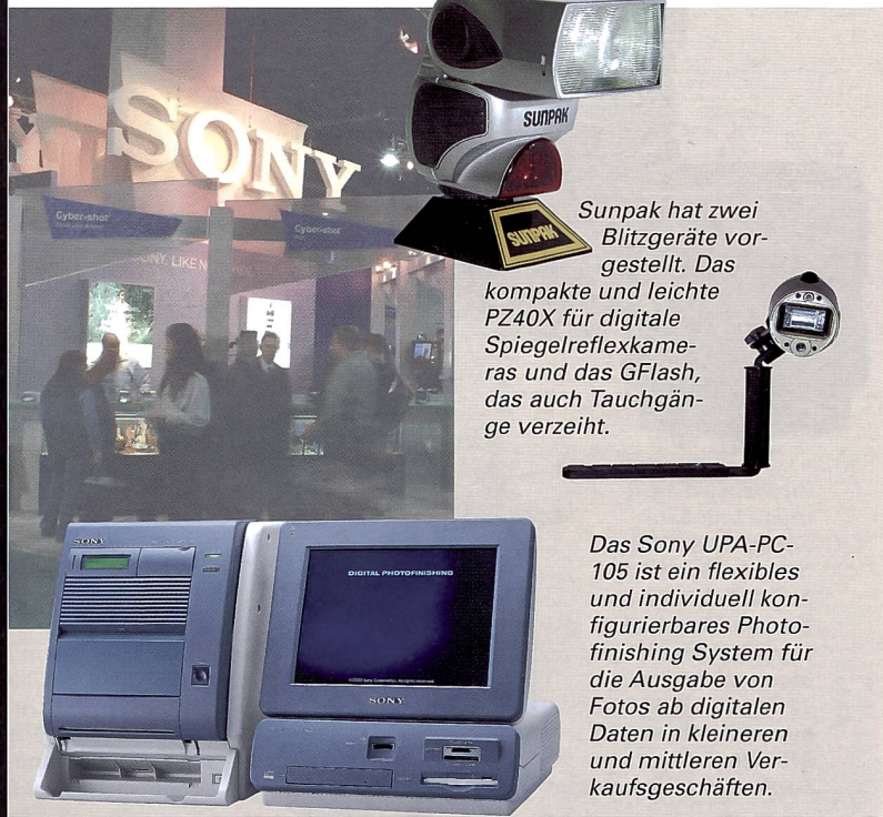
Sunpak hat zwei Blitzgeräte vorgestellt. Das kompakte und leichte PZ40X für digitale Spiegelreflexkameras und das GFlash, das auch Tauchgänge verzeiht.

nen Kontaktbogen und ist ICC Color Management fähig. Sam kann auch direkt mit der Sinar m kommunizieren für eine optimale Integration ins System. Für den Betrieb der neuen Komponenten hat Sinar die CaptureShop 5.0 Software auf der Basis des Betriebssystems Mac OS X lanciert. Der neue CaptureShop 5.0 kann ICC Profile verarbeiten, erkennt die angeschlossenen (Sinar)-Kamerakomponenten und liefert neue, TIFF-basierte Rohfiles.