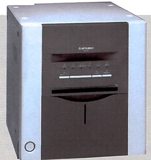
Die Mitsubishi Thermoprinter liefern Bilder in Fotoqualität ab Rolle.