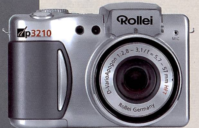
Die Rollei dp3210 entspricht mit ihrem optischen Zehnfachzoom den Wünschen engagierter Hobbyfotografen.