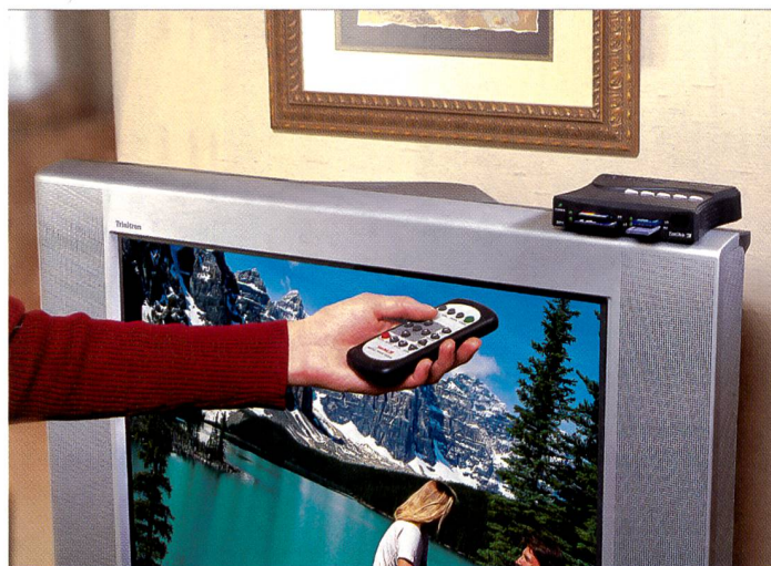
«Plug and Play» – die Einfachheit des Kartenlesers überzeugt. Praktisch bei jedem Fernsehgerät funktioniert er auf Anhieb.

Der gute alte Diaabend kehrt zurück ins digitale Zeitalter. Mit einem Gerät, das Bilder von Digitalkameras direkt ab Speichermedium in ansprechender Form auf dem Fernsehgerät oder der Heimkinoanlage mit Projektor darstellt. Ohne dass dazu ein Computer benötigt wird.