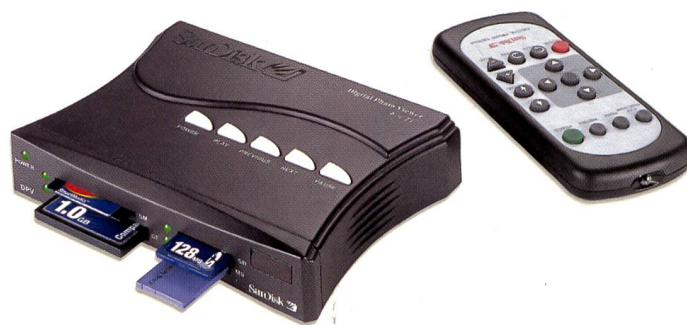
Die Funktionen lassen sich optimal mit der mitgelieferten Fernbedienung anwählen. Erfreulich deren verständliche Beschriftung in Deutsch.

schwach beleuchteten Räumen. Per Fernbedienung kann man die Fotos Ein- und Auszoomen, um Details besser betrachten zu können.