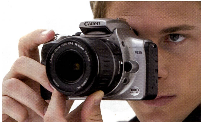
Die preisgünstige Canon EOS 300D ermöglicht den einfachen Einstieg in die Digitalfotografie.

Zum absoluten Kampfpfeis von nur Fr. 1698.- bringt Canon jetzt eine digitale Spiegelreflexkamera auf den Markt, die mit 6,3 Mpix. dem Amateurfotografen den Anschluss an die digitale Profiklasse erschliesst.