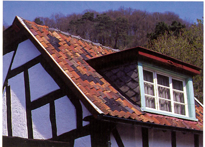
Dank sehr feiner Körnigkeit und guter Schärfe eignet sich der neue E100G besonders gut für die Wiedergabe detaillierter Strukturen.

ringender Minimaldichte und ausgeglichene Kontraste auf. Seine warme Farbgebung kommt den bei Amateurfotos recht unterschiedlichen Lichtverhältnissen