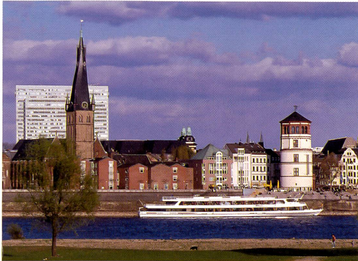
Bei kaltem, bläulichem Licht hebt Ektachrome E100GX dank seiner Farb- abstimmung den Bildeindruck vorteilhaft in eine wärmere Richtung.

belichtung mit entsprechender Verlängerung der Erstentwicklungszeit auf acht Minuten. Insgesamt gesehen bedeuten die neuen Ektachrome Professional