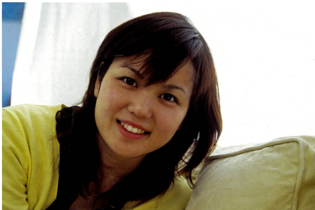
Nicht nur die beiden Profifilme Ektachrome E-100G und E-100GX, auch der Amateurfilm Elite Chrome 100, (unser Bild) wurde verbessert und zeichnet sich ebenfalls durch reine Weissen und ein tiefes Schwarz aus.

Diafilme sind in der hybriden Fotografie das wichtigste Ausgangsmaterial für perfekte Farbwiedergabe und höchste Schärfe. Das beweist die jüngste Generation der Kodak Ektachrome-Filme. Was anders ist, und welcher Film sich wozu besonders eignet, steht in diesem Praxistest.