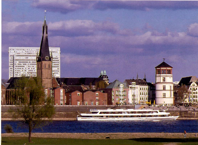
Bei kaltem, bläulichem Licht hebt Ektachrome E100GX dank seiner Farb-abstimmung den Bildeindruck vorteilhaft in eine wärmere Richtung.

belichtung mit entsprechender Verlängerung der Erstentwicklungszeit auf acht Minuten. Insgesamt gesehen bedeuten die neuen Ektachrome Professional