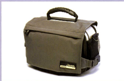
Foto- und Universalaschen von Jeep

Moderne, zweckmässige und durchdachte Taschen für Foto, Video, Audio oder sonstige schützenswerte Geräte.