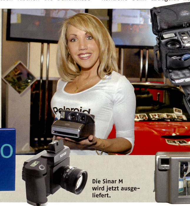
Die Sinar M wird jetzt ausgeliefert.