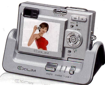
USB-Dockingstation mit Dia-Show-Funktion