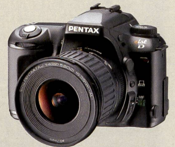
Klein und leicht: Die analoge *ist kommt demnächst als *ist D auch digital.

Gehäuses aus einer Magnesiumlegierung. Dank des als Zubehör erhältlichen Batteriemagazins mit Hochformat-Griff liegt die Kamera auch bei hochformatigen Aufnahmen perfekt und sicher in der Hand. Für den Anschluss eines externen Blitzgeräts steht ein Blitzschuh zur Verfügung. Blende, Verschluss und Schärfe lassen sich wahlweise manuell oder automatisch einstellen. Gezeigt wurden zudem folgende Wechselobjektive (die Werte in den Klammern entsprechen denen von Kleinbildkameras.): 1:2,8/300 mm (600 mm), 1:2,8 - 3,5/14 - 54 mm (28 - 108 mm), 1:2,0/50 mm Makro (100 mm) sowie 1:2,8 - 3,5/50 - 200 mm (100 - 400 mm). Weitere Details zum neuen SLR-System von Olympus auf Seite 16.