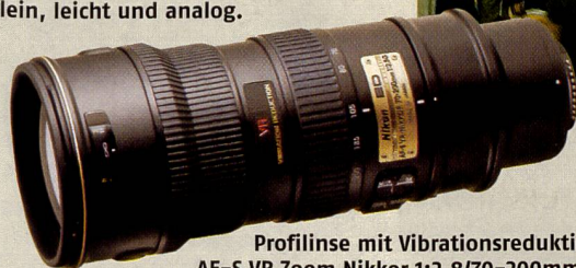
Profilinse mit Vibrationsreduktion: AF-S VR Zoom Nikkor 1:2,8/70-200mm G.

Mit dem Dimage Messenger hat Minolta auf der PMA eine Software gezeigt, die es ermöglicht, einen oder mehrere bestimmte Bildteile zu markieren, zu vergrössern und den Ausschnitt oder das ganze Bild mit einem Text zu versehen. Wird das Bild per E-Mail versandt, kann der Empfänger seinen eigenen Kommentar hinzufügen und das Bild retournieren oder weiter senden. Ausserdem können Bilder, Ausschnitte und Kommentare ausgedruckt und archiviert werden.