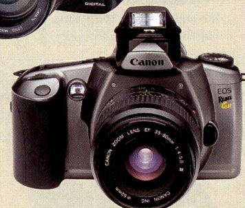
Die analoge Canon EOS 300V heisst in den USA "Rebel" GII