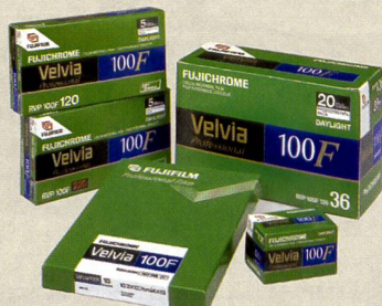
Der Velvia 100F von Fujifilm ist in KB, 120 und 4x5" Formaten erhältlich.

20,8 MP: Digitales Rückteil für Fujifilm G680.