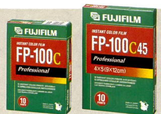
Die neuen Sofortbildfilme von Fujifilm, FP-100C und FP-100 C45.

Kodak zeigte als Weltpremiere die Easy Share LS633 Zoom Digital mit OLED-Display sowie die als Zubehör erhältliche Printer-Dockingstation 6000 für Thermosublimationsdrucke im Format 10 x 15 cm (siehe Fotointern 4/03). Als weitere Digitalkamera des EasyShare Systems zeigte Kodak die DX6340 Zoom , eine 3 Mpix-Kompaktkamera mit optischem 4fach Zoom von Schneider Kreuznach, Mehrzonen-AF und manuellen Einstellmöglichkeiten. Ab April ist eine neue Easy Share Software Version 3,0 im Internet kostenlos verfügbar.