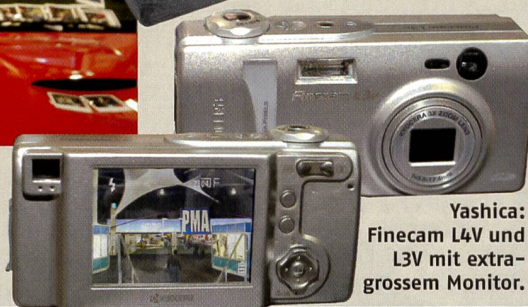
Yashica: Finecam L4v und L3v mit extra-großem Monitor.

fert. Die digitalen Rückteile Sinarback 54 und 43 sind ab sofort mit einer Firewire -Schnittstelle ausgestattet. Ausserdem läuft die Software CaptureShop 4.0 neu auch unter den Betriebssystemen OS 9 und OS X. Die Software kann kostenlos vom Internet heruntergeladen werden. CaptureShop verfügt über diverse neue Features wie eine blitzschnelle Interpolation von Bildausschnitten für perfekte Previews, Mehrfachbelichtungen und zusätzliche Funktionen beim Einblenden von Layoutskizzen, Bildern oder Previews ins Livebild.