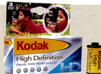
Kodak High Definition: Markteinführung in Europa noch ungewiss.