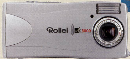
Rollei dk3000 mit D-Vario Apogon 1:2,8-5,9/3,8-11,8 mm, entspricht 38-76mm im KB.