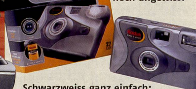
Schwarzweiss ganz einfach: Einfilmkamera B/W von Kodak.