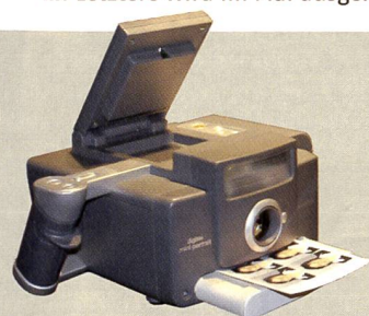
Polaroid zeigte die digitale Miniportrait Passbildkamera (oben), den neuen T690 Sofortbildfilm (unten) und die trendige Sofortbildkamera Polaroid One (Bild rechts).

Einer der grossen Vorteile der digitalen Fotografie, die sofortige Bildkontrolle, greift oft nicht, weil die viel zu kleinen Monitoren keine schlüssige Bildbeurteilung – vor allem bei starkem Sonnenlicht – zulassen. Kyocera schafft hier Abhilfe, indem den neuen Finecam L4v und Finecam L3v einen besonders grossen 2,5 Inch LDC-Monitor eingebaut wurde. Die beiden Kameras sind in der Ausstattung praktisch identisch, sie verfügen über ein 1:2,8–4,7/5,8–17,4 mm optisches Zoom (entspricht 38–115mm bei Kleinbild), elektronischen Verschluss mit Zeiten von 4s