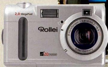
Rollei d20 motion für bewegte Bilder.