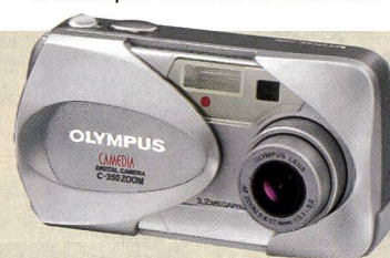
Camedia C-350: Ideal für Einsteiger.