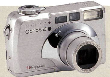
Zuwachs bei Pentax: Optio 550.