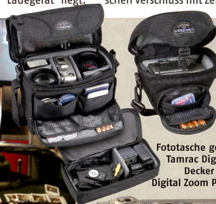
Fototasche goes Digital: Tamrac Digital Double Decker (links) und Digital Zoom Pack (oben).