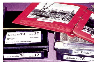
Für Recherchen muss oft auf die kostbaren Originale zurückgegriffen werden.

Basisinformationen gesichert sind. Im gleichen Arbeitsschritt werden die Originale so digitalisiert, dass jederzeit hochwertige A4 Kopien ausgedruckt werden können. Dabei erhalten die Files eine eindeutige Identifikation. Die