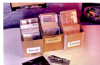
Kostbare Originale sind oft in zerfallenden Pergamintaschen von der Feuchtigkeit bedroht.

se Datensätze (Bild- und/oder Metadaten) können dann in eine einfache FileMaker- oder Access-Datenbank eingespeist werden. Zusammen mit den gewonnenen Metadaten können so schon die ersten Recherchen effizient und auf