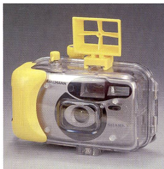
Preisgünstige Unterwasserkameras: Cullmann Sharky und Nemo

Zoom und verschiedenen Grössen für beinahe alle erhältlichen Kameras. Auf der Website www.ewa-marine.de sind eine ausführliche Typenliste, sowie viele interessante Praxistipps und Hinweise für erfolgreiche Unterwasserfotos zu finden.