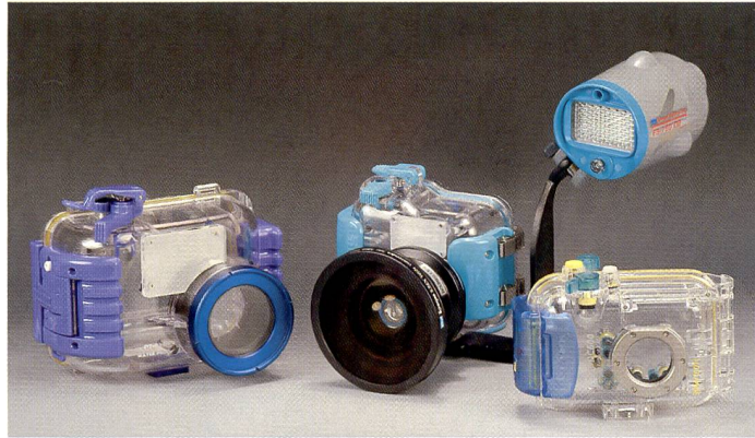
Von Olympus sind verschiedene Unterwassergehäuse erhältlich.

Für Canon Kameras sind die Gehäuse der DC-Reihe erhältlich. Die verschiedenen Typen lassen sich mit jeweils einer bis vier Kameras verwenden.