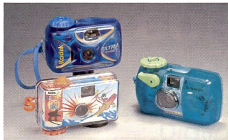
Wasserfeste Einfilmmarkas ver-ziehen Kapriolen.

Es kann frustrierend sein: Da behaupten viele Fotografen immer wieder, sie würden bei schlechtem Wetter die besten Bilder machen. Doch in der Gebrauchsanweisung zur Kamera steht klar und deutlich zu lesen: «Schützen Sie Ihre Kamera vor Nässe». Gerade Digitalkameras, mit ihrer komplexen Elektronik sind empfindlich und zu teuer, als dass man sich damit auf Experimente einlassen würde. Und so bleibt manches stimmungsvolle Bild vom sommerlichen Gewitterregen, vom tosenden Wasserfall oder dem Schneegestöber auf