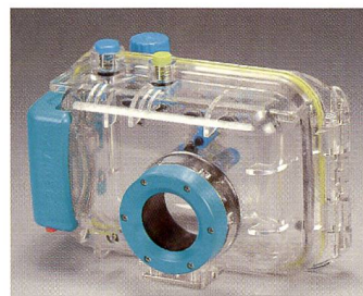
Das neue O-WP1 für die Pentax Optio-Modelle 330/430.

einfach geschlossen und erst einmal ohne Kamera während 15 Minuten untergetaucht. Wichtig ist, dass das Gehäuse nicht in warmes Wasser getaucht wird und dass zum Reinigen keine Lösungsmittel, Öle