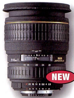
Sigma 20-40 mm F2,8 EX DG DF ASP

Sigma-Objektive mit der Bezeichnung D wurden für hochauflösende SLR-Digitalkameras entwickelt. Denn nur mit diesen Objektiven hält der Digitalfotograf alle Feinheiten und Tonwerte, die der Chip erkennen kann, fest. CCDs benötigen bis 130 Linienpaare Auflösung, einfache Standard SLR-Objektive leisten durchschnittlich jedoch nur 50 Linienpaare.