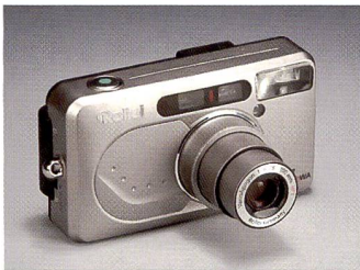
Weitwinkel 3,6fach Zoom und einfache Bedienung über den grossen LCD-Monitor sind besondere Eigenschaften der Prego 100 WA.

Mit dem Modell Prego 100 WA Data hat Rollei eine wertige Zoomkompakte im Programm. Sie gehört zu den kleinsten Kleinbild-Kompaktkameras auf dem Markt und ist mit einem 1:5,8/28-100 mm Vario Apogon mit HFT-Vergütung ausgestattet. Diese spezielle Beschichtung reduziert die Reflexion an den Glas-