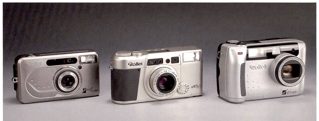
Rollei Prego 100WA, Rollei AFM35 und Rollei d41 com heissen die Rosinen aus der Rollei Kompaktreihe.

Rollei pflegt neben ihren professionellen Mittelformatkameras eine interessante Linie von analogen und digitalen Kompaktkameras, die kaum bei einem Grossverteiler zu finden sind, jedoch als Geheimtipp herumgereicht werden. Wir haben drei Rosinen für Sie herausgepickt.