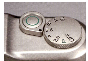
An der edelkompakten Rollei AFM35 lassen sich Blende und Entfernung manuell einstellen.

Möglichkeit, manuell zu fokussieren und die Blende vor zu wählen, richtet sich die AFM35 an die Gruppe von