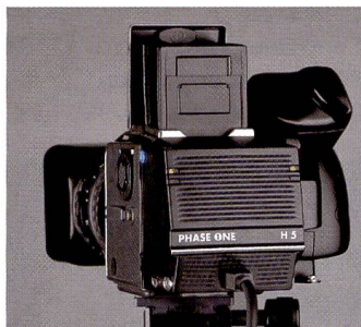
Das neue H5 von Phase One als preiswertes Einsteigermodell.

Das aktuelle Angebot von Phase One umfasst drei digitale Rückteile, die sich unter anderem auch für die Porträtfotografie eignen. Das neue Phase One H 5 ist die preiswerte Möglichkeit, in die Digitalfotografie einzusteigen. Das Kamerarückteil wurde auf der Grundlage erprobter Technologien konstruiert und kann in bestehendes Studioequipment integriert werden. Das Phase One H5 kann für Hasselblad Kameras, Mamiya RZ67 Pro II, Contax 645AF und Mamiya 645 AF geliefert werden und lässt sich mittels entsprechenden Adaptern an weitere Kameras montieren.