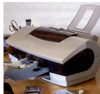
Canon S900 überzeugt mit exzellenten Ergebnissen.

grössert die zu druckenden Bilddaten, teilt sie auf mehrere Seiten auf und druckt diese Seiten dann auf separate Blätter. Werden diese Blätter wieder aneinandergesetzt, erhält man einen entsprechend vergrösserten Ausdruck in Posterformat.