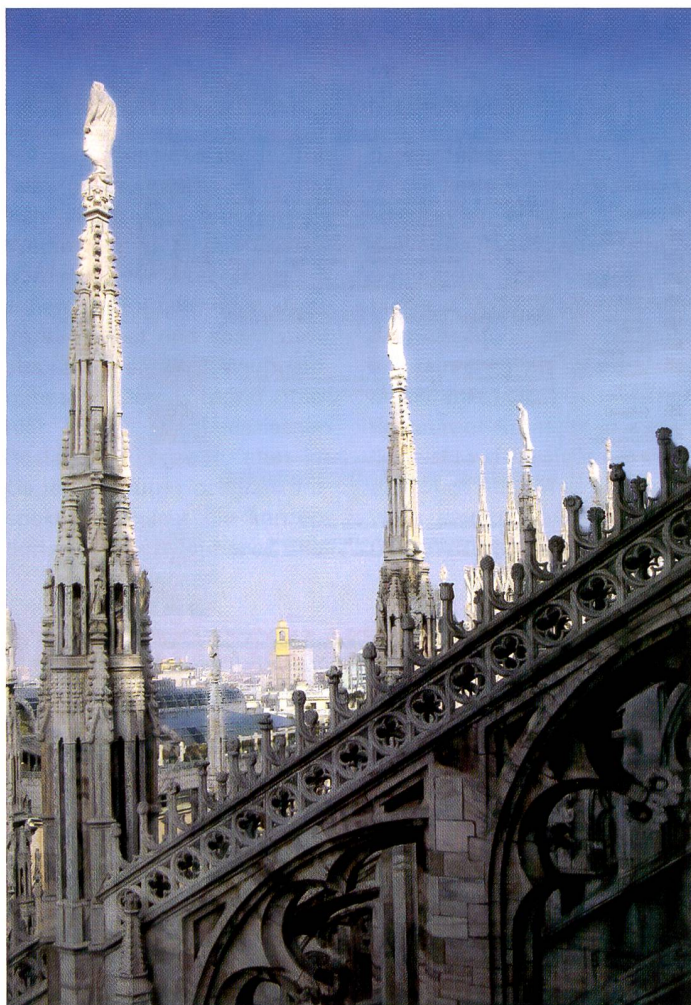
Randlos: Dieses Bild druckte der Canon S900 innert Minuten aus.

Der Konkurrenzkampf im Druckersegment geht unvermindert weiter. In immer kürzerer Folge werden neue Inkjet Printer auf dem Markt eingeführt. Gleichzeitig werden diese immer günstiger und dennoch technisch ausgefeilter.