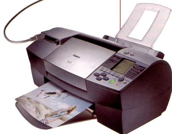
BUBBLE JET PRINTER S820D