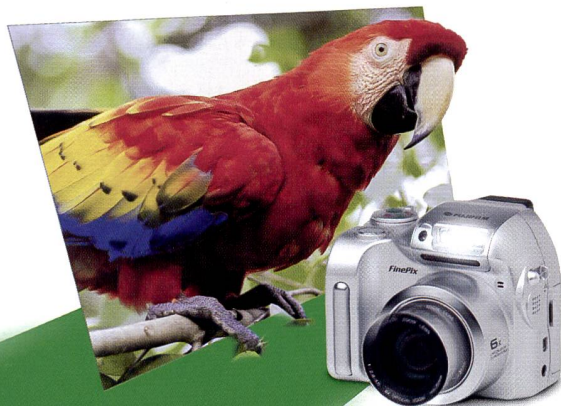
FinePix 2800 Zoom – in der Klasse der 2-Mio.-Pixel- Kameras (1600x1200 Bildpunkte) einfach näher dran sein!