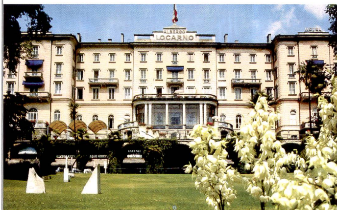
Unser Tagungsort: Grand Hotel Locarno

Grazie mille Marco Garbani und bis bald im Ticino