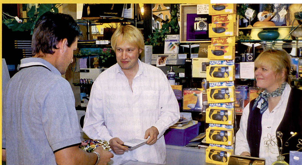
Foto Salomon hat eine sehr breite Kundschaft, die aus Pully, Lutry, ja bis St. Sulpice nach Lausanne an die Avenue Tissot kommt. Das Geschäft ist gut erreichbar, liegt in Bahnhofnähe und – das ist mitentscheidend –

es gibt Parkplätze vor dem Laden. Die vorwiegende Stammkundschaft schätzt ganz besonders die konstante und hervorragende Bildqualität von Foto Salomon. Nie kämen sie auf die Idee, ihren Film in eine anonyme Tüte zu stecken und sind dafür gerne bereit, etwas tiefer in den Geldbeutel zu greifen.