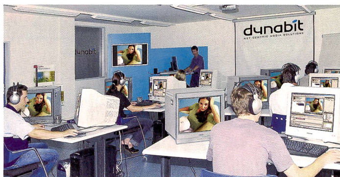
Blick in einen grosszügig gestalteten Schulungsraum der Dynabit AG. Jeder Kursteilnehmer hat seinen kompletten Arbeitsplatz.

Die Firma Dynabit AG in Hünenberg bietet nicht nur Gesamtlösungen rund um die visuelle Kommunikation, sondern auch Kurse und Workshops zu Hard- und Software. Zudem gehört sie zu den Pionieren im Bereich des Streaming Media.