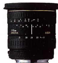
SIGMA 17-35 mm F2,8-4,0 EX ASPHERICAL HSM