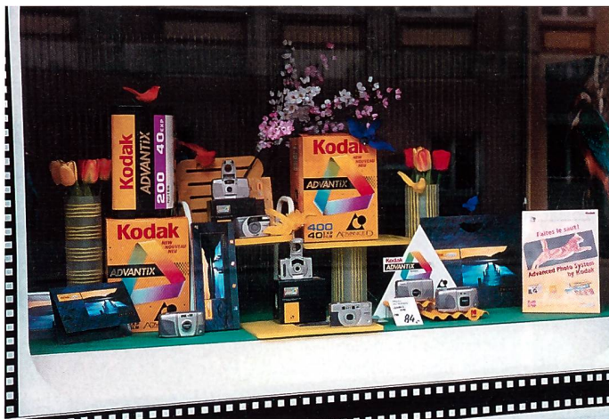
Die prämierten Schaufenster zum Thema «Frühling» von Photo du Temple, J.-C. Matthey aus Le Locle (links) und Foto A. Scheidegger aus Basel (rechts).

Schaufenster und schicken Sie die Fotos mit Adresse auf der Rückseite an Kodak. Den Wettbewerb zum Thema Frühling, dessen Einsendeschluss bereits der 15. Juni war, haben Foto A. Scheidegger aus Basel und Photo du