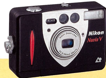
Nikon Nuvis V