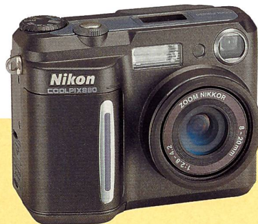
Nikon Coolpix 880

Zur photokina stellt Nikon drei wichtige Produkte vor: eine Digitalkamera mit 3,3 Mpix, ein Spiegelreflexmodell, neue Objektiv und eine Nuvis APS-Kamera.