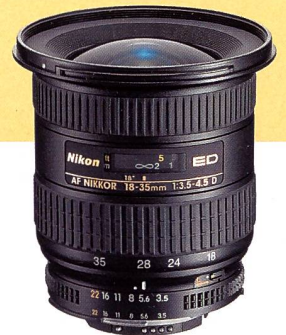
AF Zoom-Nikkor 1:3,5-4,5/18-35 mm

der Gestaltung seiner Aufnahmen lieber manuell arbeitet, kann die Automatikfunktionen abschalten.