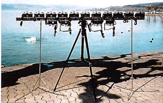
Um absolut identische Filme belichten zu können, wurden 15 Minolta-Kameras auf ein Gestell montiert.

Heiri Mächler, Rapperswilerstrasse 7, 8630 Rüti, Tel. 055/240 13 60, Fax -- 49 94