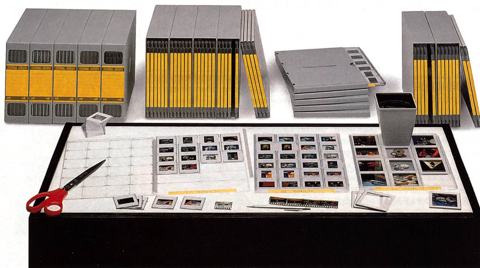
Das Journal 24 Archivierungssystem besteht in der Hauptsache aus buchförmigen, transparenten Sichtkassetten, in denen die Dias gegen Staub und mechanische Verletzungen gesichert aufbewahrt sind.

Unter den Dia-Archivierungssystemen hat sich das Journal-System der Firma Archivtechnik Kunze seit drei Jahrzehnten bewährt. Das System bietet nicht nur die praktischen Sichtkassetten, sondern auch ein breites Sortiment von Zubehör, von der Lupe über das Leuchtpult bis hin zu kompletten und platzsparenden Archivschränken.