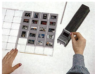
Nicht nur die Übersicht ist ein grosser Pluspunkt des Systems, sondern auch die schnelle Handhabung, um die Dias aus den Sichtkassetten in die Projektionsmagazine umzufüllen.

Kernprodukt des Journal-Systems ist eine bereits schon vor 30 Jahren entwickelte flache Sichtkassette, bestehend aus zwei durchsichtigen Kunststoffhälften (Hartpolystyrol), die man wie ein Buch aufklappen kann, um 24 gerahmte Kleinbilddias im Format 24 x 36 nebeneinanderliegend darin unterzubringen. Die Grösse der Kassette (21 x 27,5 cm) richtet sich nach dem DIN A4-Format (21 x 29,6 cm) mit der Überlegung, dass man sich an ein genormtes Format anlehnt das seinerseits die Dimensionen von Schrank- und Regalfächern, Boxen, Kartons, Versandtaschen usw. geprägt hat. Die Kassette nimmt 24 Dias auf: vier nebeneinander in sechs Reihen übereinander. Um in der Höhe Platz zu gewinnen und innerhalb des A4-Formates zu bleiben, entschied man sich für eine sogenannte "geschuppte Lagerung". Analog etwa zu Dachziegeln sind die Dias leicht schräg mit den Oberkanten über den Unterkanten der darüberliegenden Reihe gelagert. In beide Kassettenhälften