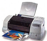
Stylus Photo 875 DC

Mit der neuen Generation der 6-Farb-Tintenstrahldrucker setzt EPSON neue Qualitätsmassstäbe beim Fotodruck.