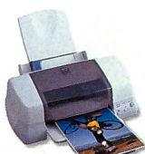
Stylus Photo 870