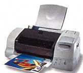
Stylus Photo 875 DC

Mit der neuen Generation der 6-Farb-Tintenstrahldrucker setzt EPSON neue Qualitätsmassstäbe beim Fotodruck.