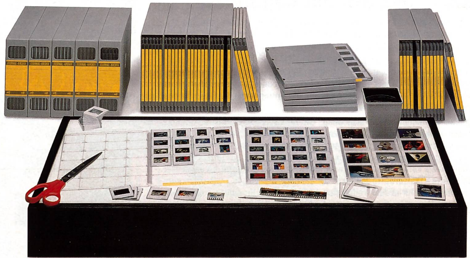
Das Journal 24 Archivierungssystem besteht in der Hauptsache aus buchförmigen, transparenten Sichtkassetten, in denen die Dias gegen Staub und mechanische Verletzungen gesichert aufbewahrt sind.

Unter den Dia-Archivierungssystemen hat sich das Journal-System der Firma Archivtechnik Kunze seit drei Jahrzehnten bewährt. Das System bietet nicht nur die praktischen Sichtkassetten, sondern auch ein breites Sortiment von Zubehör, von der Lupe über das Leuchtpult bis hin zu kompletten und platzsparenden Archivschränken.