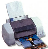
Stylus Photo 870