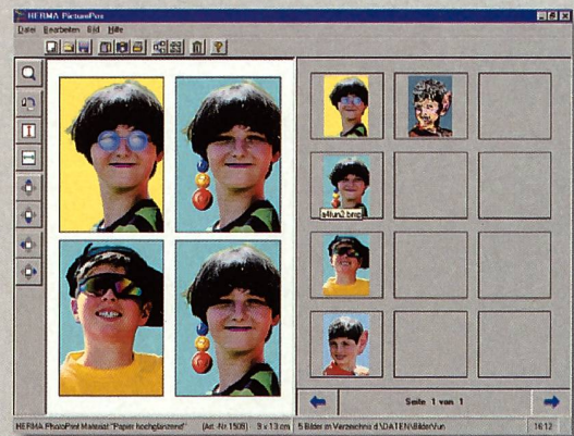
Die kostenlose Plazierungs-Software von Herma ist eine wertvolle Hilfe, um die Bilder optimal anzuordnen.

Herma trägt dieser Entwicklung Rechnung und hat ihr Sortiment an Druckmedien in letzter Zeit massiv ausgebaut. Neben verschiedenen Papieren mit matter, seidenmatter oder hochglänzender Oberfläche in Büro- und Fotoqualität, sind auch verschiedene formatunterteilte Fotopapiere mit Mikroperforation im Angebot, die ein exaktes und mühsames Ausschneiden überflüssig machen.