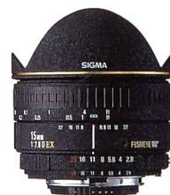
SIGMA 2,8/15 mm EX DIAGONAL FISHEYE