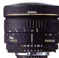
SIGMA 4,0/8 mm EX CIRCULAR FISHEYE

Das diagonale Fisheye-Objektiv liefert eine hervorragende Abbildungsqualität mit hohem Bildkontrast. Der 180° Bildwinkel und die geringe Einstellentfernung von nur 15 cm eröffnen eine einzigartige Welt fotografischer Einsatzmöglichkeiten. Der Folienfilterhalter hinter der Rücklinse erlaubt die problemlose Anwendung von Gelatinefiltern. Optische Höchstleistung und einfache Handhabung gewährleisten die ganze Bandbreite kreativer Fotografie.