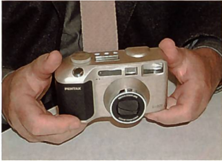
«Die Pentax EI-200 sieht aus wie eine konventionelle Zoomkompaktkamera.»

ren Zoomkompaktkameras passt. Sie sieht aus wie eine Kamera und nicht wie eine digitale Designstudie.