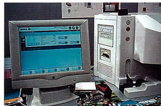
Neben dem Touch-Screen befinden sich die Laufwerke für alle digitalen Datenträger.