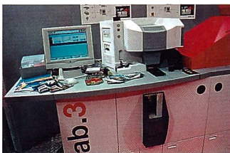
Das Agfa d-lab.3 ist auf einfache Bedienung und universellen Einsatz konzipiert.

Ein solches technologisch neuartiges System wie das Agfa d-lab.3 muss ein möglichst einfaches Bedienkonzept aufweisen. Agfa hat sich für eine intuitive grafische Benutzeroberfläche entschieden, die in enger Zusammenarbeit mit Fachleuten für Ergonomie entwickelt wurde. Zentrales Element ist ein grosses TouchScreen-Display mit einer logischen Bedienungsführung und grossen berührungsempfindlichen Tasten. Die Display-Anzeige erlaubt jederzeit den Zugriff auf fünf Hauptmenüs und drei allgemeine