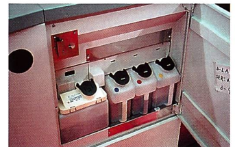
Der Nassteil des Agfa d-lab.3 ist auf einfache Handhabung und Betriebssicherheit ausgelegt.

auf die Anforderungen der ultrakurzen Belichtungszeit des Lasers von nur rund 100 Nanosekunden pro Pixel abgestimmt ist.