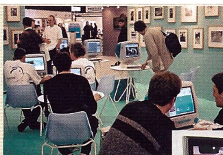
Digitale und analoge Bildpräsentationen begegnen sich.

Für kleinere Budgets dürfte die Pentax MX-30 ein sehr beliebtes Modell werden. Die beleuchteten Symbolanzeigen – wie bei der MX-7 – faszinieren, und die Kamera bietet ein ausgezeichnetes Preis-/Leistungsverhältnis. Besonders im preisbewussten französischen Markt dürfte sie ein Renner werden.