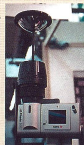
Powell eVision: Digitalkamera für Panorama-Aufnahmen.