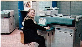
Das Digital-Minilab von KIS ist preisgünstig und leistungsfähig.

mit Lexmark entwickelten Tintenstrahldrucker, der die Daten ohne dazwischen geschalteten PC ausdruckt.