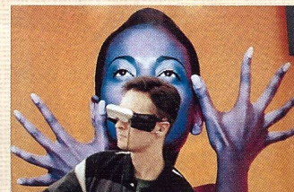
Bilderlebnis im Cyberworld-Zeitalter: Olympus Eye-Trek fasziniert die Besucher.

sprach mit FOTOintern. «Die Filmhersteller und viele Aussteller rein professioneller Produkte hätten weiterhin eine reine Fachmesse vorgezogen». Gefördert wurde die Öffnung der Messe auch durch eine Gutscheinaktion in allen wichtigen Fotozeitschriften Frankreichs, die ihre Leser mit vergünstigten Eintritten lockten.