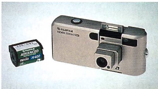
Fuji Nexia 2000ix

• Kodak demonstrierte den neuen Personal Picture Maker Kit. Dieser besteht aus der Digitalkamera DC215 Zoom und einem neuen gemeinsam