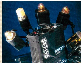
Am Balcar Nexus-Generator können alle Lampenköpfe angeschlossen werden.

• Das digitale Minilab von KIS/Photo-Me aus heimischer Produktion ist eines der günstigsten des Marktes. Es können Kleinbild-, APS- und 120er-Filme verarbeitet sowie Diapositive und Aufsichtsvorlagen eingescannt werden.