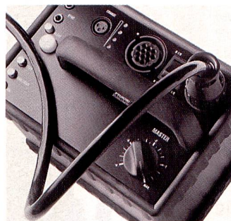
Ideal «on location»: Der akkubetriebene Pro-7b Generator.

Das Pro-7 Sortiment umfasst ein vielseitiges Blitzsystem, das für alle Arten der Fachfotografie universal eingesetzt werden kann. Weitere Infos: Light+Byte AG, 8047 Zürich, Tel.: 01/493 44 77, Fax: 01/493 45 80