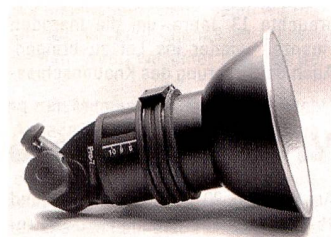
Pro-7 Lampenkopf und Reflektor: Praxisorientiertes Design

dass irgend welche Überlastungs- und Überhitzungssymptome auftreten.