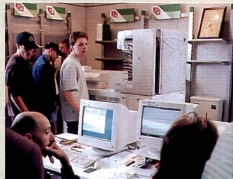
Star des Tages: Digitales Minilab Frontier 350