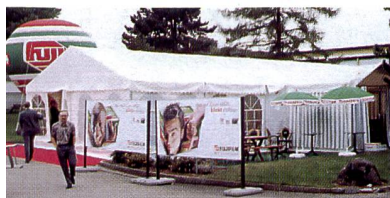
Gastronomie und Unterhaltung im Zelt.

läuft, wie wir dies gerne hätten ... Es hat sich aber schon jetzt gezeigt, dass sich diese Investition gelohnt hatte. Sie hat sogar einen patriotischen Aspekt, wenn Sie so wollen, denn hätten wir Jendostorf nicht gekauft, so hätte es CeWe getan, und dann wäre ein weiterer beträchtlicher Teil des Schweizer Bildergeschäftes ins Ausland abgewandert.»