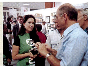
Ideale Gelegenheit, um Fachfragen zu diskutieren.