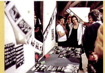
Das Bad Pfäfers bei Bad Ragaz war ein gediegener Rahmen für die erste Ostschweizer Diplomfeier der Fotofachangestellten.

nur wenige – Gelegenheit, die Prüfungsarbeiten zu besichtigen, die im geräumigen Dachstock mit viel Mühe ausgestellt wurden. Danach erfolgte das eigentliche Zeremoniell der Diplomübergabe an die 16 jungen Fachkräfte, die nach der dreijährigen Lehrzeit die Prüfung bestanden und einen kräftigen Applaus verdient hatten. Ein kleiner Imbiss rundete den gemütlichen Tag ab, der den jungen Absolventinnen und Absolventen noch lange und auf angenehmste Weise in Erinnerung bleiben dürfte.