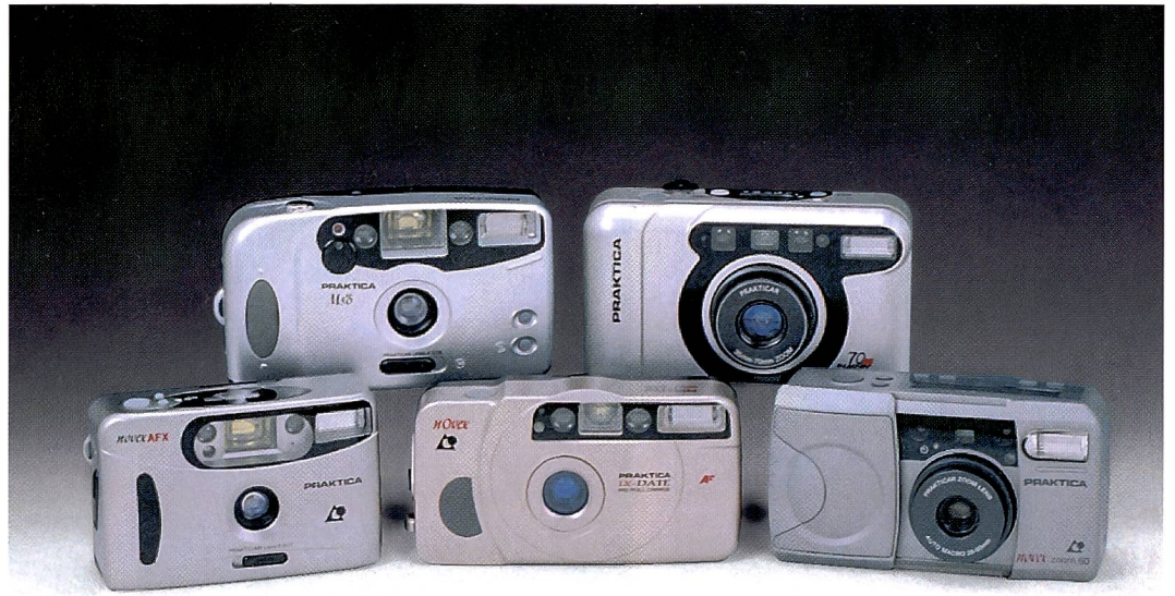
Die neue Kamerareihe von Praktica präsentiert sich in modischem, metallähnlichem Design.

Dass sich hinter dem Namen «Praktica» keine Topprodukte mit einer technischen Ausstattung für höchste Ansprüche verbergen, muss wohl kaum besonders hervorgehoben werden. Dennoch ist das Preis-/Leistungsverhältnis dieser Produkte ebenso interessant wie die Marge, die mit einer solchen Alternativmarke für den Fotohandel übrig bleibt. Alle der insgesamt 11 neuen Kameramodelle, die in der Schweiz durch die Firma Bopp in Effretikon vertrieben werden, präsentieren sich in einer durchaus preiswerten Qualität, mit einer technischen Ausstattung, die als «praxisgenügend» bezeichnet werden kann. Hier einige Beispiele aus dem Praktica-Sortiment: